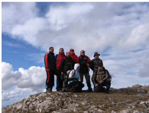
... и планинари

Видљивост је на врху била неочекивано добра тако да смо "као на длану" видели Ртањ, шумадијске планине, ... Повратак је уследио стандардном стазом која води низ Капуту и Дуги До све до водопада Велики бук и планинарског дома Суваја где смо стигли око 16:00 часова. Задовољни и помало уморни планинари кренули су у 17:00 часова за Велику Плану и Смедеревски Паланку.