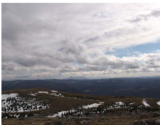
Ртањ у даљини

Видљивост је на врху била неочекивано добра тако да смо "као на длану" видели Ртањ, шумадијске планине, ... Повратак је уследио стандардном стазом која води низ Капуту и Дуги До све до водопада Велики бук и планинарског дома Суваја где смо стигли око 16:00 часова. Задовољни и помало уморни планинари кренули су у 17:00 часова за Велику Плану и Смедеревски Паланку.