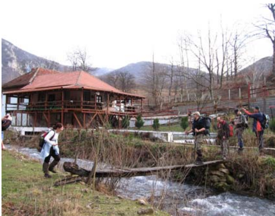
Прва препрека на стази

Од планинарског дома кренули смо у 8:30 ка Лисинама а затим ка водопаду Велики бук али не асфалтним путем већ западно од постојећег пута преко Турског брда да би изашли на плато изнад водопада. Наставили смо узводно речицом Врело до њеног извора. Како су због временских услова који су владали у последње време, водотокови са високим водостајем, уживали смо у призорима водопада, брзацима и изузетном врелу речице Врело.