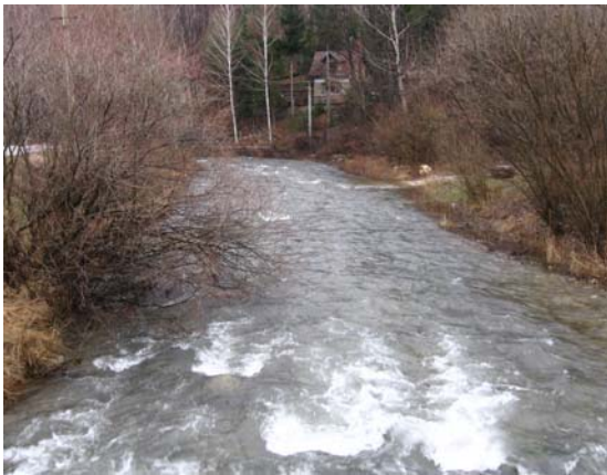
Ресава испред планинарског дома Суваја