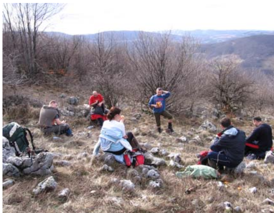
Одмор и освежење

Од извора почиње врло стрм успон кроз шуму ка гребену Бељанице. Ово је био и најтежи део трасе ка врху. При крају овог стрмог успона наишли смо на маркирану стазу којом смо наставили ка гребену Бељанице. Даље смо уз краће паузе за одмор и освежење наставили преко Соколице (где се маркација губи) и Говедаришта (релативно раван део). Уследио је мањи успон преко Градиништа и излазак на врх Бељанице око 13:00 часова.