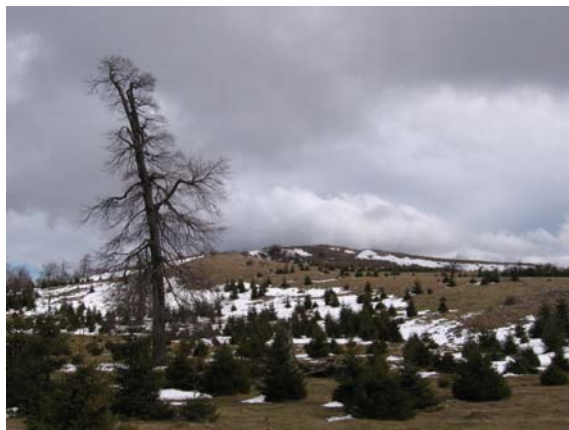
Врх Бељанице је испред нас