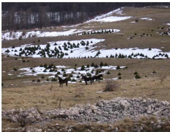
А на врху коњи ...