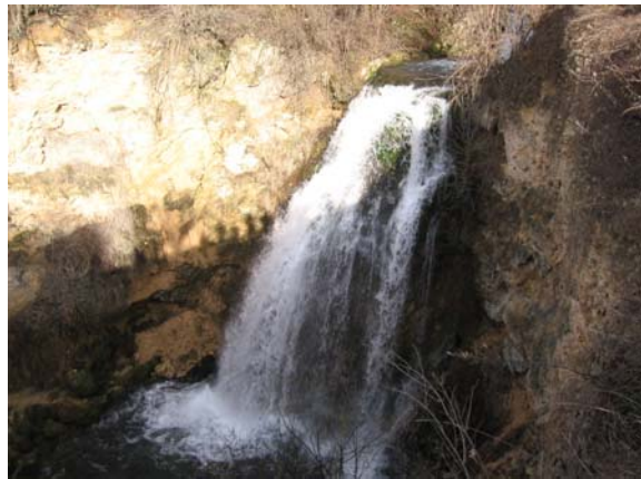
Водопад Велики бук

Од планинарског дома кренули смо у 8:30 ка Лисинама а затим ка водопаду Велики бук али не асфалтним путем већ западно од постојећег пута преко Турског брда да би изашли на плато изнад водопада. Наставили смо узводно речицом Врело до њеног извора. Како су због временских услова који су владали у последње време, водотокови са високим водостајем, уживали смо у призорима водопада, брзацима и изузетном врелу речице Врело.