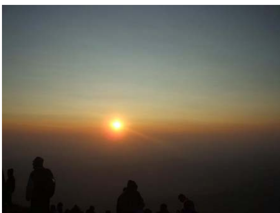
Свитање око 4 сата

Киша је претила да ће знатно отежати, ако не и онемогућити успон, али је на срећу око 8 сати увече престала да пада. По познатој сатници, на успон се кренуло пола сата после поноћи. По хладном, ветровитом и магловитом времену на Шиљак, највиши врх Ртња (1565 m), наша екипа је стигла око 4 сата ујутро. Још је био мрак, а планинари су, добро утопљени, заузели положаје за осматрање свитања. Иако је било облачно време, излазак сунца се ипак лепо сагледавао.