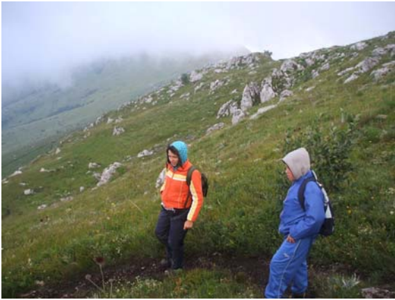
Силазак са Шиљка