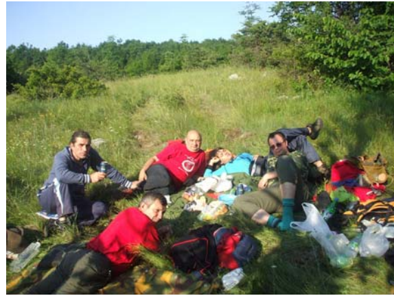
Одмор у подножју Ртња

Око 10 сати смо кренули за Сокобању где смо провели неко време, а затим смо отишли до Бованског језера, где је већ по традицији, било организовано купање.