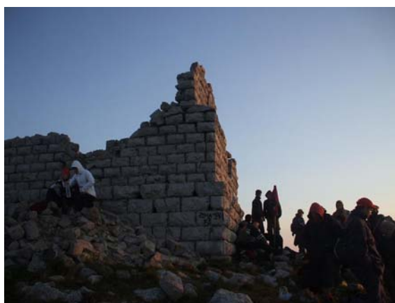
Шиљак 1565 м