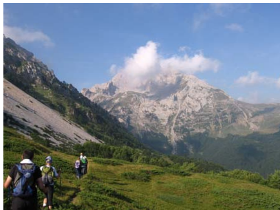
Ми на стази, Кучки Ком у облаку

Успон је успешно извршило 12 планинара, одлично обележеном стазом која на неколико места има експониране детаље који неискусним и неспремним планинарима могу представљати проблем. С обзиром да су временски услови били такорећи идеални, у повратку се није журило и планинари су могли да уживају у прелепим призорима Комова али и да се заслуде укусним шумским јагодама и боровницама.