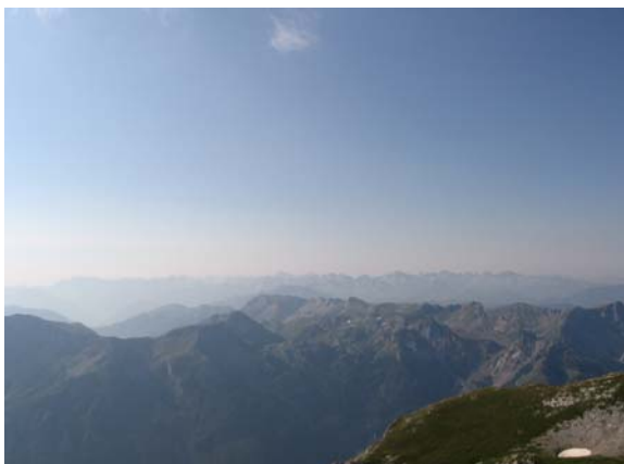
Проклетије у даљини