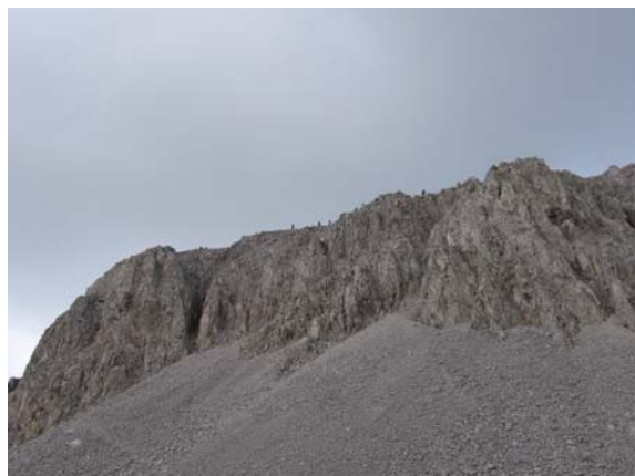
На гребену Кучког Кома