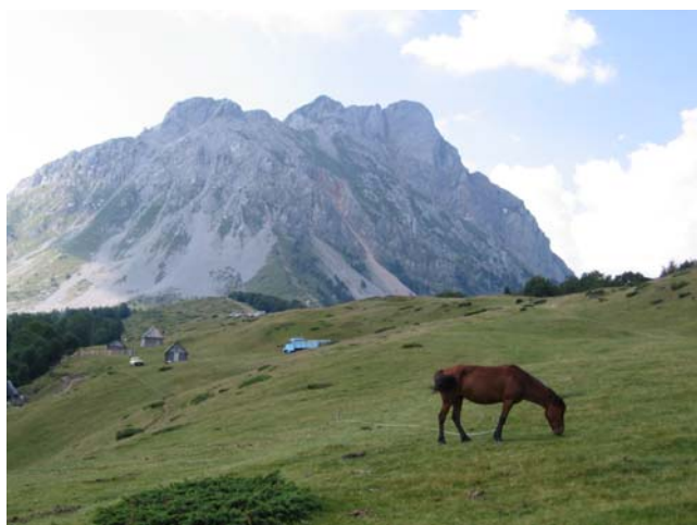
Призор са Штавне

Све у свему, викенд проведен како се само пожелети може, а на Комове ћемо доћи поново, то је сигурно.