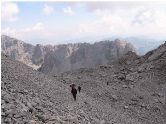
Призор који подсећа на неку другу планету

Успон је успешно извршило 12 планинара, одлично обележеном стазом која на неколико места има експониране детаље који неискусним и неспремним планинарима могу представљати проблем. С обзиром да су временски услови били такорећи идеални, у повратку се није журило и планинари су могли да уживају у прелепим призорима Комова али и да се заслуде укусним шумским јагодама и боровницама.