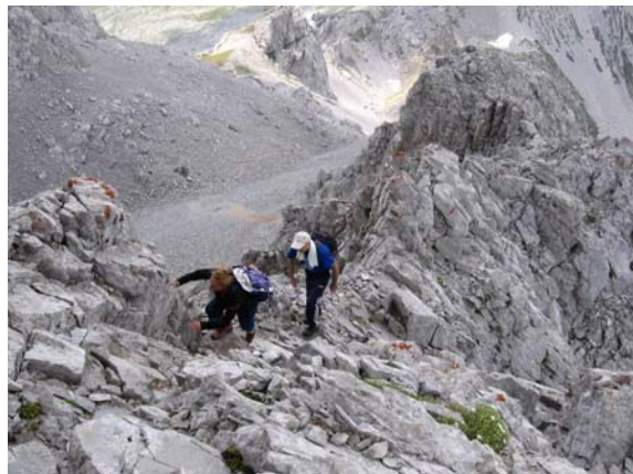
Завршни део успона