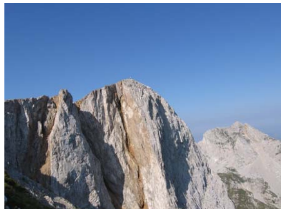
Неко је већ на врху