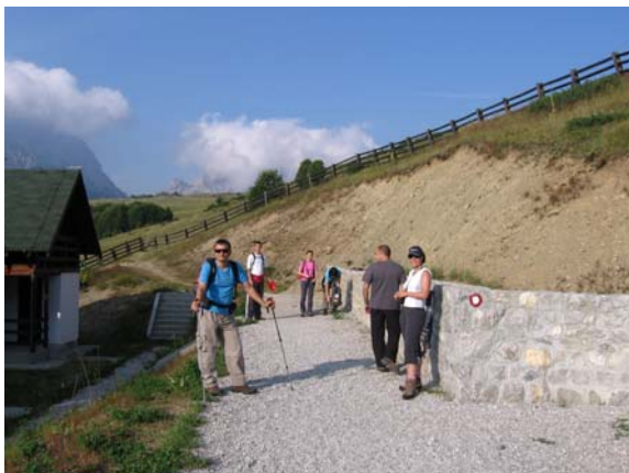
Припреме за полазак

Група од 17 планинара из Београда, Новог Сада, Панчева, Смедеревске Паланке, Велике Планае, Баточине, Краљева и Чачка стигла је око 6:15 у суботу 1. августа и после смештања у удобне објекте Еко-катуна Штавна, тачно у 8:00, како је програмом и било предвиђено, кренула на успон на Кучки Ком.