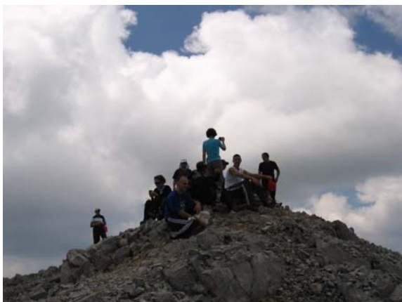
Одмор на врху