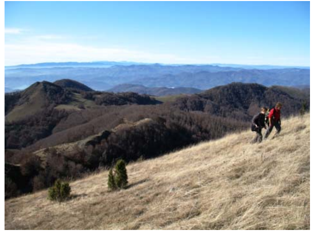
Uspon na Ciganski grob