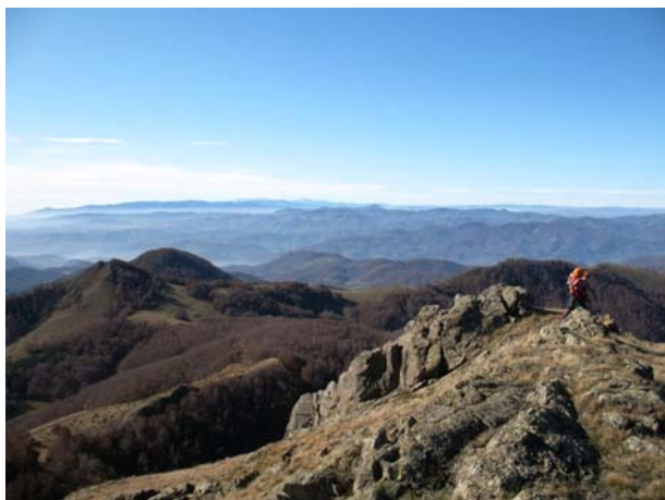
Na Ciganskom grobu

U subotu smo nas 170 po predivnom vremenu, sa retko vidjenim vidicima, prepešačili od rudnika Žuta prla (dokle nas je organizator dovezao autobusima iz Leposavića), preko vrhova kao što su Ciganski grob i Čardak, sve do Šatorica. Nakon toga smo se spustili u selo Borčane, gde je u bivšoj školi organizovano kolektivno spavanje (naravno i ručak). Tog dana smo prepešačili 21,5 km sa usponom oko 1150 m.