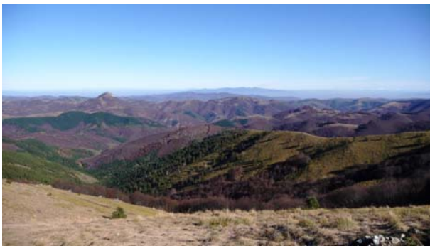
Jesenje boje južnog Kopaonika