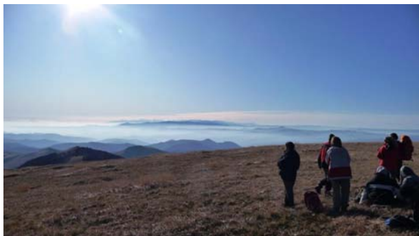
Pogled sa Šatorice

Naime, PSD "Kopaonik" iz Leposavića organizovao je republičku akciju pešačenja po južnim grebenima planine Kopaonik, sa usponom na više vrhova od kojih je najviši vrh Šatorica – 1750 mnv.