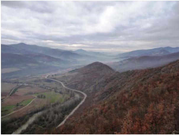
Pogled na Leposavić sa Klika