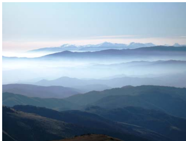
Ovde komentar nije potreban

Drugog dana u nedelju smo se većim delom spuštali niz kanjon Bojatinske reke (sa preko deset zanimljivih prelazaka reke preko improvizovanih mostića), zatim preko sela Mošnice i sela Dobrava, grebenom Klika – vratili se do Leposavića. Tog dana smo prepešačili oko 22,5 km sa usponom oko 700 m.