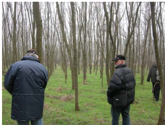
Нисмо се изгубили