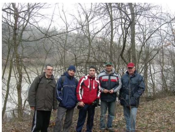
На језеру Лукар