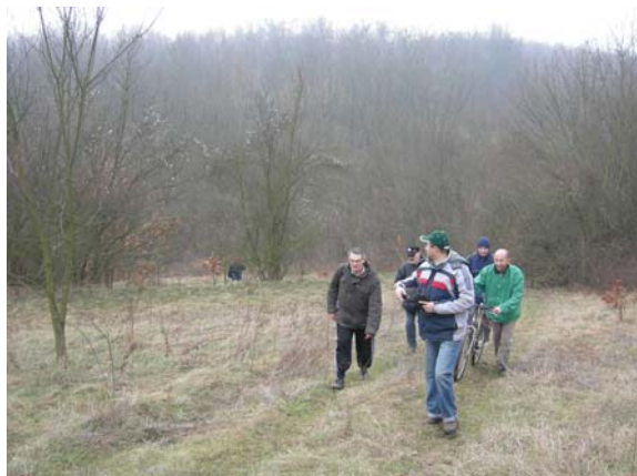
На брдима око Крњева

Након тога, група је извела успон на брда изнад Крњева – 232 м, обишла крњевачко виногорје и спустила се до вештачког језера у долини Лукар. При повратку планинари су обишли и Мали подрум „Радовановић“ где су били у прилици да дегустирају врхунска вина.