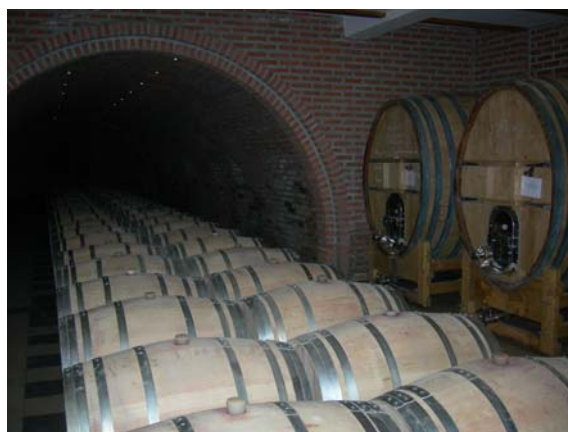
Мали подрум Радовановић

На крају похода, у дружењу уз пасуљ сумирани су резултати похода: око 15 км пешачења и висинска разлика од око 200 м, са обиласком занимљивих места.