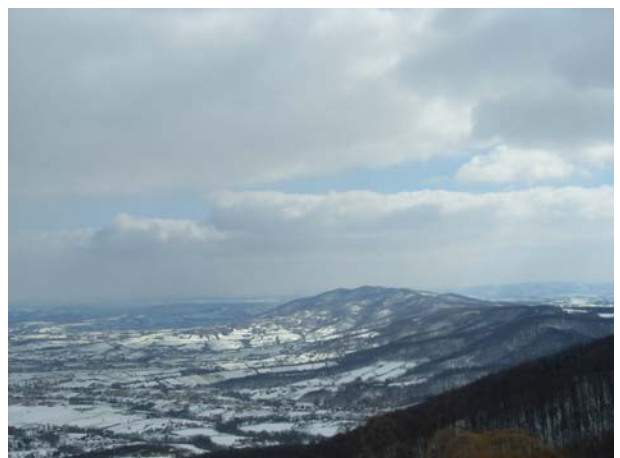
Са видиковца, поглед 2