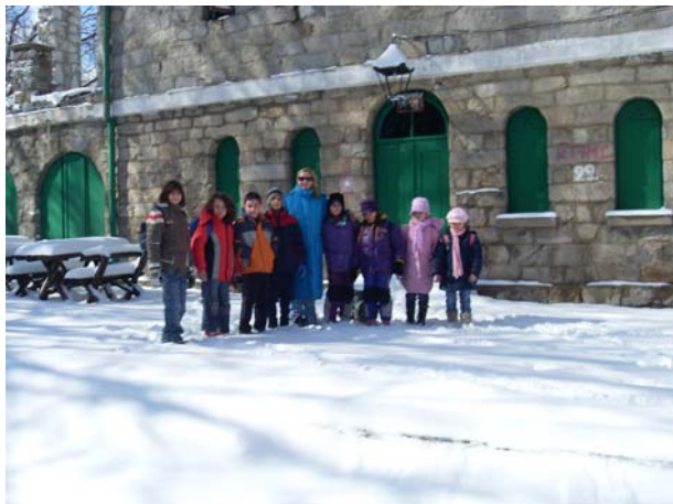
Планинари основне школе ...

До врха Букуље стигли смо након сат и 15-30 минута. После пењања на видиковац, планинари су се одморили и загрејали у отвореном угоститељском објекту, а затим лагано спустили до бањског парка.