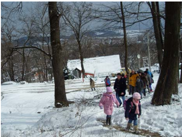
Први успон за најмлађе ...