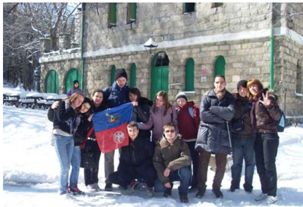
... и гимназије на Букуљи