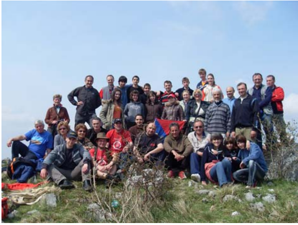
Сви на Жежевцу