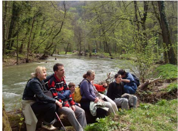
Пауза поред Млаве

У повратку, обишли смо Петровац и цркву у Четережу (брвнара и нова црква).