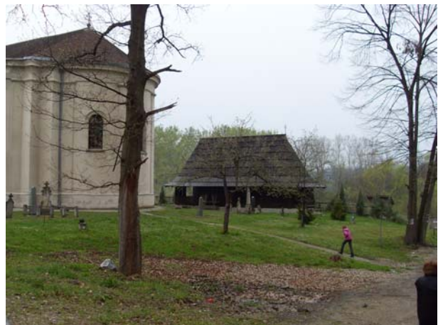
Црква брвнара и нова црква у Четережу

У акцији је учествовало укупно 36 планинара, од тога 15 чланова планинарске секције у Гимназији, 1 члан ПК Јасеница из Смедеревске Паланке, 1 члан ПД Челик из Смедерева и 1 члан ПД Јеленак из Панчева.