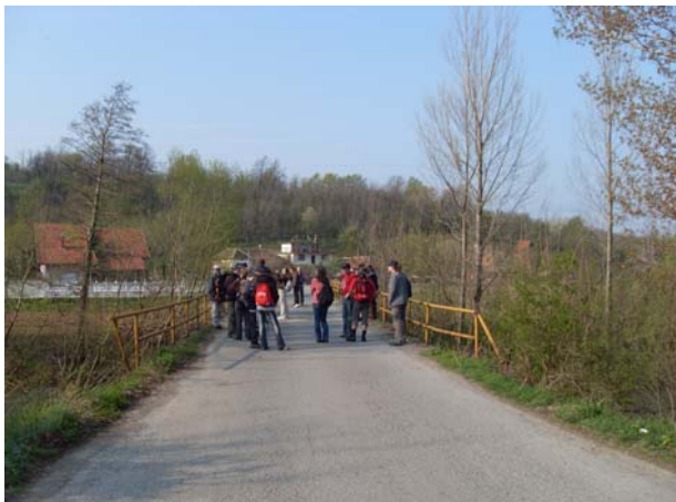
Припреме за полазак на мосту преко Млаве

Из Велике Плана кренули смо око 7:00 да би до Ждрела, одакле смо кренули на успон стигли око 8:30.