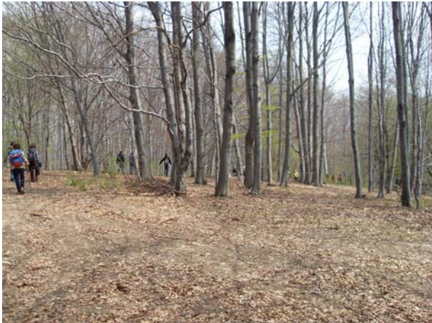
Кроз манастирску шуму

Спустили смо се до Манастира Горњак, где смо се такође задржали неко време, а према Великој Плани кренули смо око 15:30.