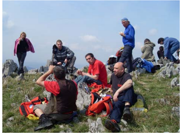
Одмор и уживање на врху

Спуштање са Жежевца изведено је другом, јужном падином, кроз још неолисту букову шуму, а стаза се углавном пружа шумским путевима.