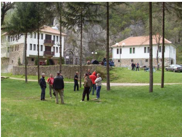
У порти манастира Горњак

У повратку, обишли смо Петровац и цркву у Четережу (брвнара и нова црква).