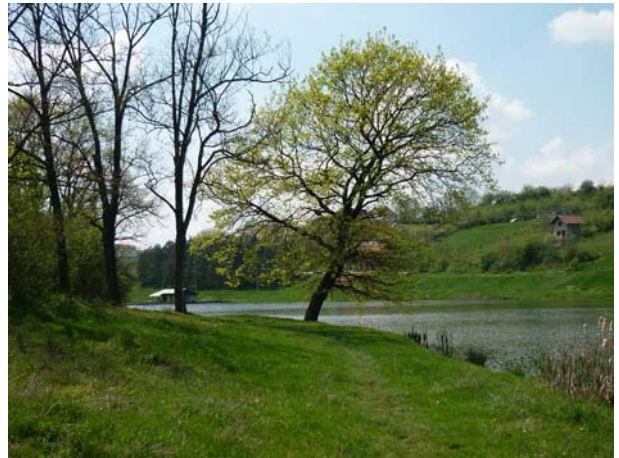
Поред језера "Кудреч 1"