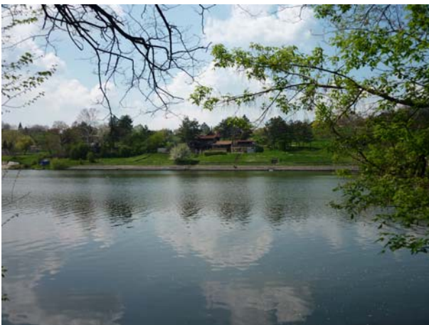
Тамо је наш циљ