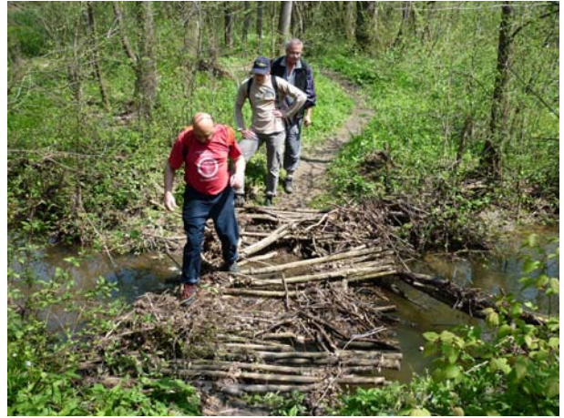
Ех тај мостић ...