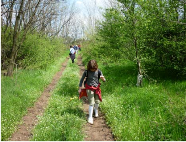
Ех то блато ...