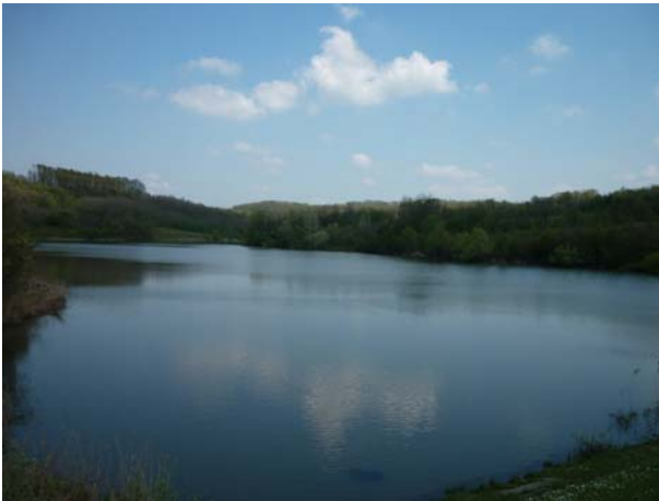
Језеро "Кудреч 2"