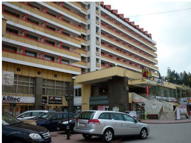
Овде смо били смештени

У Синаји смо били смештени у истоименом хотелу, који може да добије само похвале. Планинари најчешће нису навикли на овакав луксуз, али понекад добро дође и мало уживања у удобном смештају. Синаја је иначе лепо уређен градић са пуно интересантних вила, неколико хотела и пријатним парком са језерцем и фонтаном.