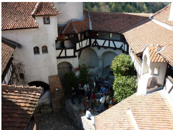
У дворишту замка грофа Дракуле

У поподневним сатима свратили смо до Брана и познатог замка грофа Дракуле. Замак сам по себи није оставио неки већи утисак на мене (можда је на то утицала и улазница од 5 ЕУР-а), али у сваком случају треба и то видети. Много већи утисак на мене су оставиле околне стрмине и оштри врхови Карпата који су били под белином снега за разлику од зелене долине у којој се налази Бран.