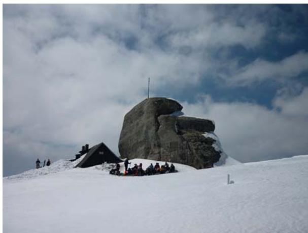
Заслужени одмор на врху – Ому 2505 м