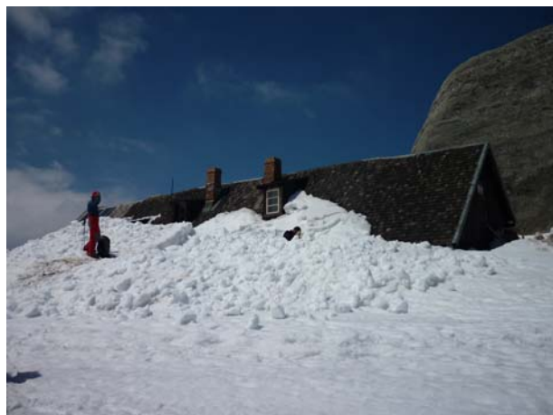
Планинарски дом још увек затрпан снегом

После одмора на врху, крећемо назад нешто после 14,00 часова. За планинаре који имају искуства у кретању низ стрме снежне падине, спуштање је право уживање, поготово када је снег у добром стању као што је био овде – неки од нас су се сјурили низ планину уживајући у снегу, лепом времену и интересантним призорима Карпата, а одмах су наишле и идеје за неке нове акције у овим крајевима. Они мање искусни морали су мало више да пазе на своје кораке кроз снег, али смо на крају сви без икаквих проблема стигли до аутобуса и вратили се до хотела око 19,00 часова.