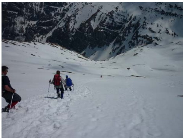
Спуст низ снежне падине

После одмора на врху, крећемо назад нешто после 14,00 часова. За планинаре који имају искуства у кретању низ стрме снежне падине, спуштање је право уживање, поготово када је снег у добром стању као што је био овде – неки од нас су се сјурили низ планину уживајући у снегу, лепом времену и интересантним призорима Карпата, а одмах су наишле и идеје за неке нове акције у овим крајевима. Они мање искусни морали су мало више да пазе на своје кораке кроз снег, али смо на крају сви без икаквих проблема стигли до аутобуса и вратили се до хотела око 19,00 часова.