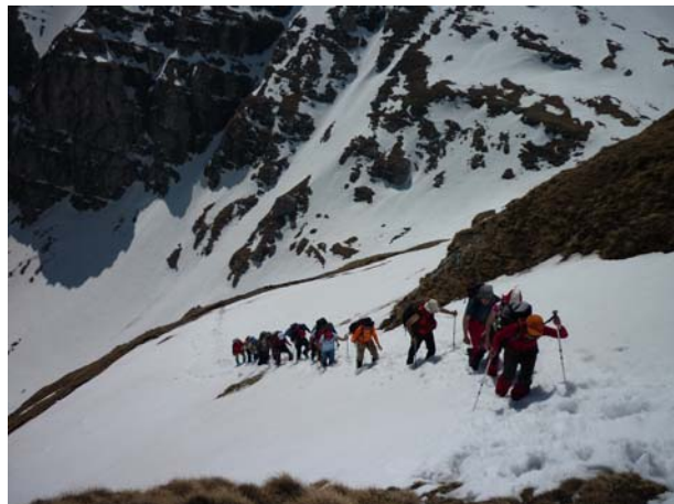
... у колони по један