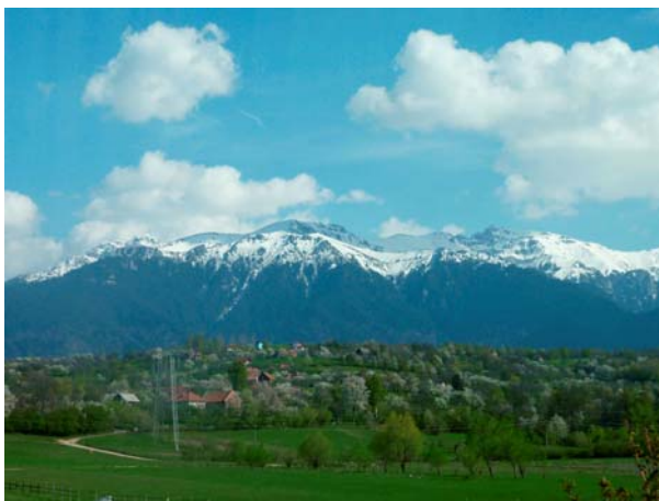
Карпати изнад Брана

У Синају, познато туристичко место на Карпатима које се налази на 900 м надморске висине, стигли смо пре мрака тако да смо имали довољно времена да се распакујемо и обиђемо град.