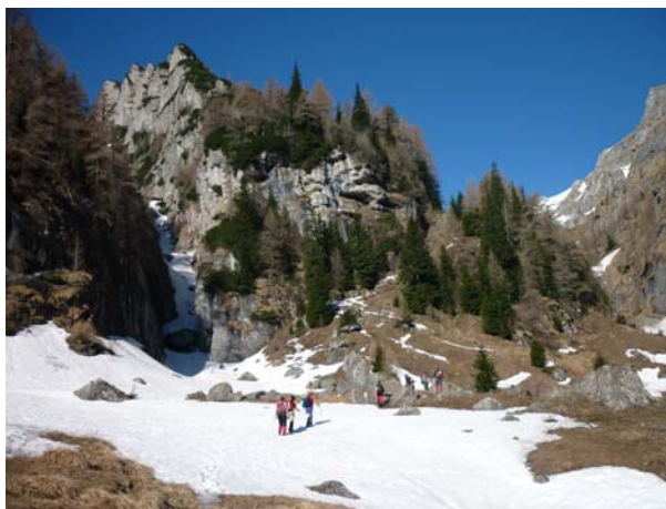
Снег већ на 1400 мнв

По изласку из шуме идемо углавном кроз расквашен снег и преко понеког острва траве или стена које користимо за одмор и паузе. Терен којим се крећемо прилично је стрм и под снегом а ми идемо као јединствена група што условљава доста спорије кретање уз пуно пауза. Иако нисам љубитељ оваквог начина планинарења, невероватно лепо време чини да ми је изузетно пријатно. Небо је ведро, температура далеко изнад нуле па до врха многи планинари стижу у кратким рукавима што је за овај период године и висину од преко 2500 м готово реткост.