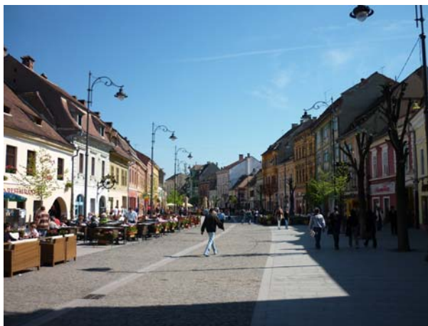
Пешачка улица у Сибиу

У поподневним сатима свратили смо до Брана и познатог замка грофа Дракуле. Замак сам по себи није оставио неки већи утисак на мене (можда је на то утицала и улазница од 5 ЕУР-а), али у сваком случају треба и то видети. Много већи утисак на мене су оставиле околне стрмине и оштри врхови Карпата који су били под белином снега за разлику од зелене долине у којој се налази Бран.