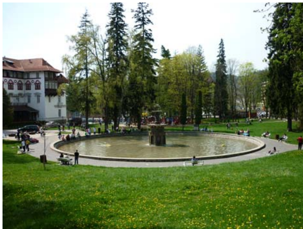
Парк у Синаји