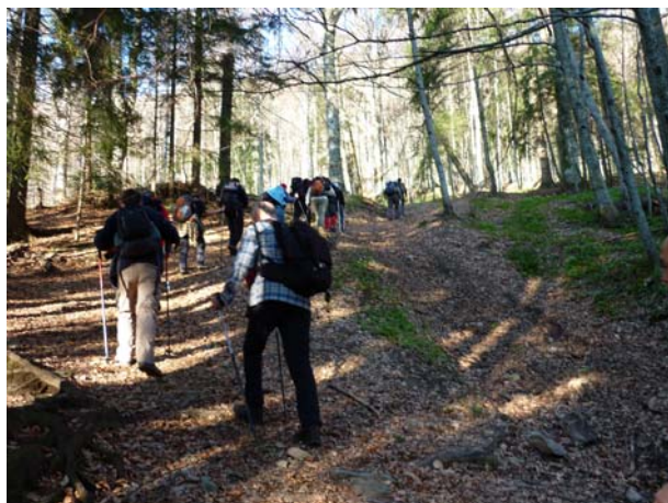
Почетак стазе је кроз букову шуму