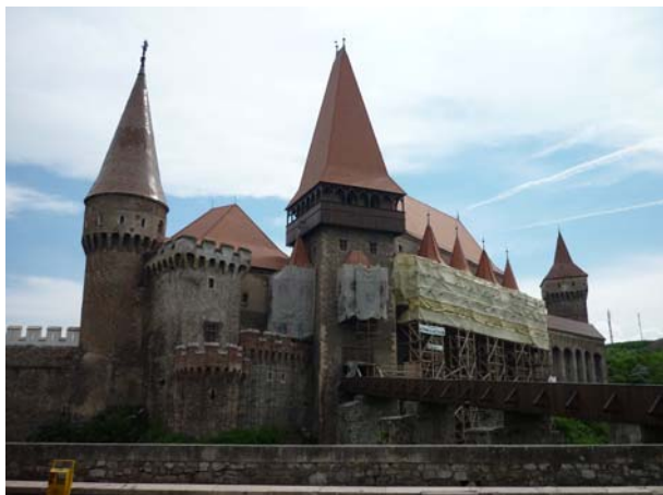
Замак Јаноша Хуњадија

У понедељак ујутру кренули смо за Србију. Успут смо посетили замак Јаноша Хуњадија односно Сибињанин Јанка како ми зовемо овог познатог владара и борца против Турака кога је народ и у Мађарској и у Румунији али и у Србији прогласио за великог хероја. Замак је изузетно очуван – један је од најочуванијих објеката овог типа у Европи, а тренутно се ради рестаурација једног његовог дела после чега ће бити у још бољем стању. Овај замак је на мене оставио изузетан утисак – једноставно нисам очекивао да уђем у замак који као да је "скинут" из неког филма о средњевековним витезовима.