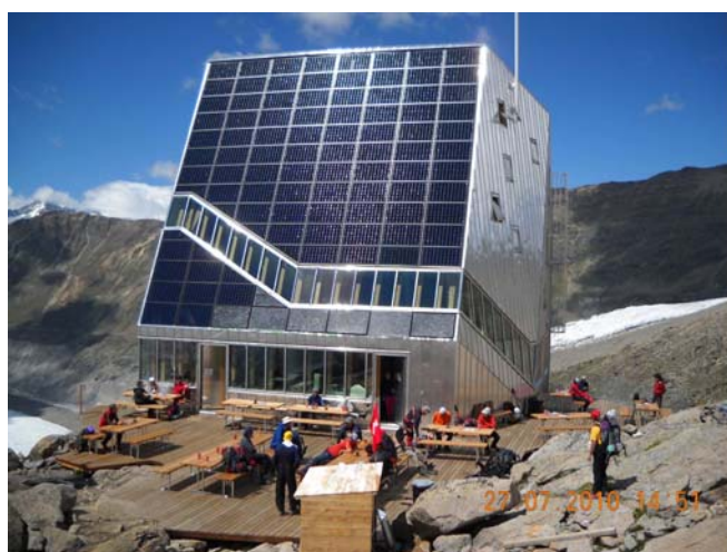
Dom Monte Rosa