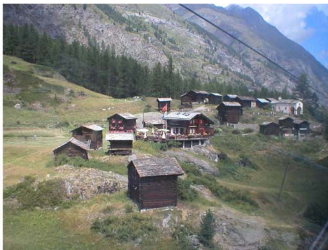
Svuda brvnare prepune cveća i turista

Po izlasku iz gondole trebalo je pripremiti se za uspon ali je između mene i Gogana došlo do nesporazuma tako da se nas dvoje nismo popeli na Breithorn, već smo se vratili u kamp. Svi ostali koji su pošli, njih trideset troje se popelo po lepom sunčanom vremenu. To večer smo se kratko prošetali po gradu i rano legli, s obzirom da smo prethodnu noć proveli u autobusu.