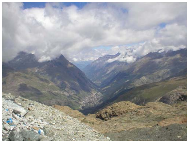
Pogled iz gondole na Zermatt sa nekih 3000m