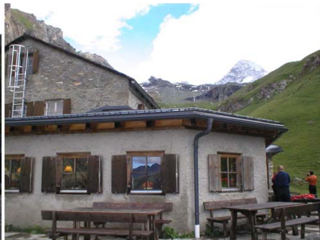
Dom Lucknerhuttenhaus, 2241m nv