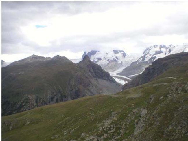
Levo, moje jučerašnje „grebenče“ i Monte Rosa u sredini

29-og jula smo sačekali osvajače Difura, spakovali kamp i krenuli, preko Italije, put Srbije. Za kraj, šta reći, neponovljivo iskustvo, Alpi su zaista nešto što treba videti i doživeti, pa na bilo koji način.