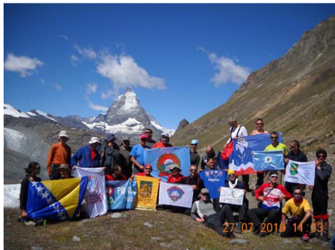
Polazak ka domu Monte Rosa