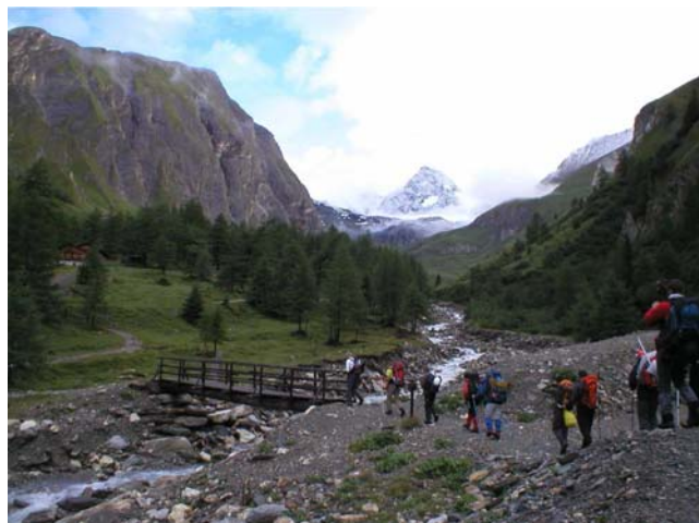
Devetnaest planinara i Grossglockner u daljini

Sve je započelo u petak, 23.07.2010. u 17 sati kad je autobus iz Skerlićeve, podno Hrama Svetog Save, krenuo na put dug 800 km. U selo Kals (Austrija) stigli smo po planu u 5 i 30. Nas devetnaest se prepakovalo i spremilo za uspon na Grossglockner, koji je najviši vrh Austrije sa svojih 3798 m, a ostali su otišli još 36 km dalje da bi popeli Grossvenediger. Vreme je bilo prijatno, svetlo oblačno, mestimično i sunčano. Na uspon smo krenuli od doma Lucknerhaus koji se nalazi na 1920 mnv. Bilo je 6 i 45.