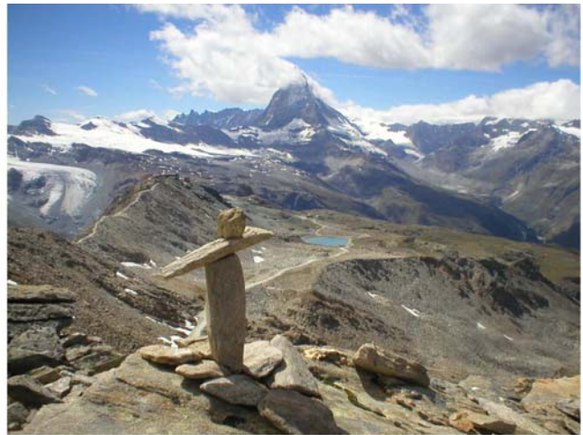
Levo je „grebenče“ od 3000m kojim sam išla

28.juli, dan uspona na Difur ja sam provela penjući se od Zermatta( koji se nalazi na 1620m) ka istočnoj strani Materhorna , stazom koja se zove Materhorn trial, pa preko Stafela na 2139m i Stafelalpa na 2408 m do Schwarzsee paradise na 2585 m. Tu me je uhvatilo nevreme tako da sam se gondolom spustila u Zermatt. Provela sam predivan dan i nemoguće je opisati šta sam sve videla.