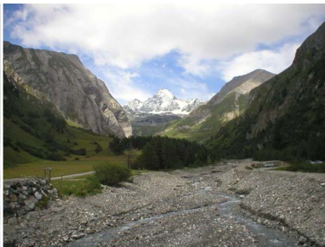
Ovako je izgledao kad smo se spustili na 1900m