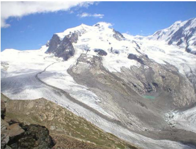
Masiv Monte Rosa sa vrhom Difurispitze