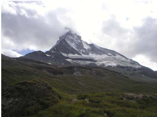
Istočna strana Matterhorna