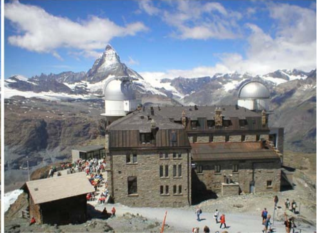
Gornergrat i Matterhorn iza