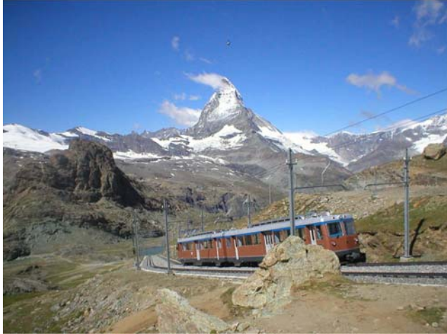
Železnica na 3000 m

Ja sam iskoristila prevoz železnicom do Rotenbodena i odatle grebenom se prvo popela do Gornergrata na 3089 m gde se nalazi ogromna opservatorija , gde ima puno posetilaca, ...tu je poslednja stanica železnice i odatle, sve grebenom, popela jedan od vrhova na njemu, Hohtalli, 3286 m. Vratila sam se ponovo do Rotenbodena i uhvatila poslednji voz u 19 i 30 za povratak u Zermatt.