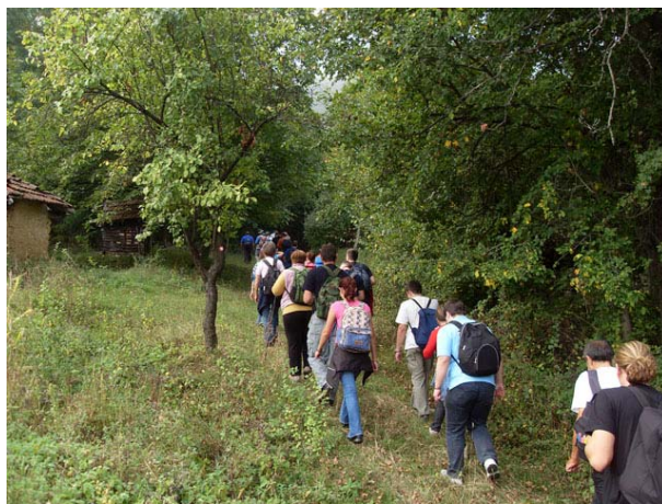
Полазак на успон

Кретали смо се у две групе различитом брзином добро маркираном стазом која води падинама Малиника. Стаза је са константним успоном, али највећим делом колским путевима.