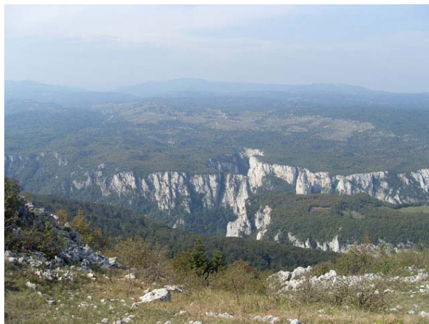
Лазарев кањон у даљини