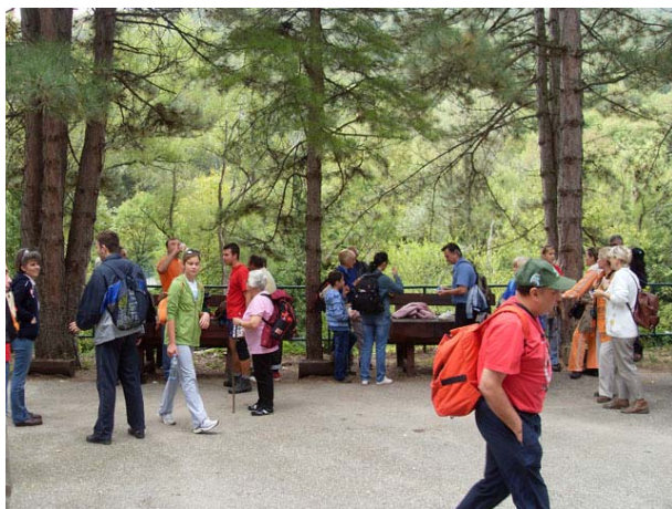
Испред Лазереве пећине

У Злоту су нас дочекали домаћини из ПД „Дубашница“. Најпре смо посетили Лазареву пећину, а затим око 10:30 кренули на успон.