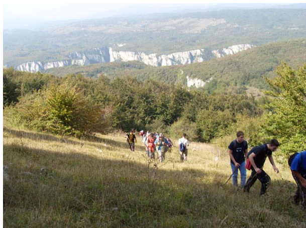
Успон на Малиник

Група која је извела успон на Малиник имала је још бољи поглед на цео Лазарев кањон, али се због грома у даљини, одлучила на ранији спуст, тако да је у Злот стигла око 17:15.