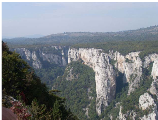
Литице Лазаревог кањона

Одавде је група од 33 спремнија планинара око 13:30 кренула на Малиник, а остали су се после нешто дужег задржавања упутили ка Злоту.