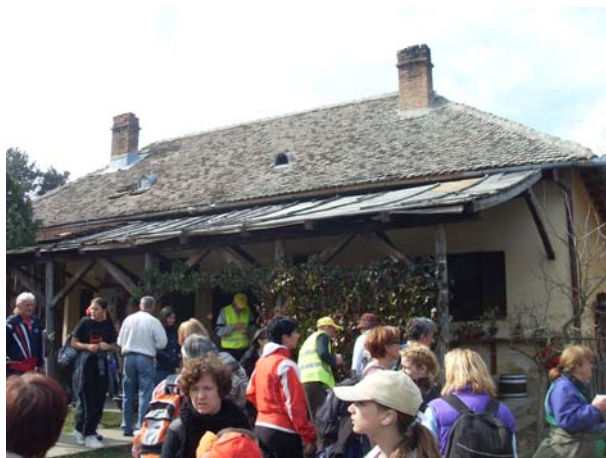
Одмор код шумарске куће

По завршетку похода, организатор је поделио захвалнице.