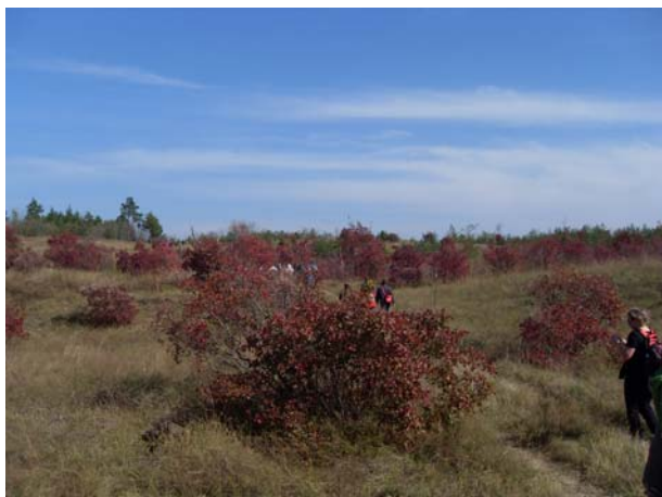
У бојама руја

Око 16:00 пристигла је са пешачења и група која је одабрала најдужу деоницу. Сунчан дан, необично топло, занимљиво растиње и наравно руј који се виђао у свим нијансама црвене (рујне) боје били су ново, пријатно, искуство за планинаре, а посебно за најмлађе чланове.