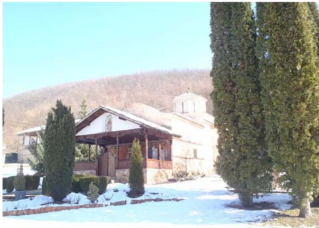
Manastir Sveti Đorđe

U nedelju smo se pozdravili sa domaćinim i krenuli put Temske gde smo obišli manastir Svetog Djordja. Nisam skoro bila u nekoj svetinji koja ima tako dobro očuvane freske iz XV-og veka. Poštovala sam zabranu slikanja, pa zato evo samo kako manastir izgleda spolja.