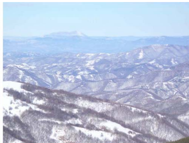
Rtanj na horizontu