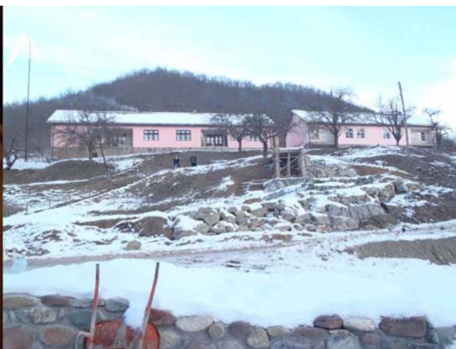
Planinarski dom u Mezdreji

Jutro je osvanulo sunčano. Nismo mnogo žurili, tako da smo posle jutarnje kafe i doručka, u 8 sati krenuli minibusom put Babinog zuba. Kratko smo se zadržali i tačno u 9 sati krenuli na uspon. Prvi put sam videla tu ski stazu o kojoj se toliko pričalo. Nije bilo mnogo skijaša. Obeležena je kao crna i crvena. Odlično izgleda. Neki drugi put bi je vredelo isprobati. Mi smo nastavili put vrha. Nije bilo mnogo snega na stazi, čak je na južnim padinama bilo mestimično i trave. Pogled na Srbiju ispod nas je bio fantastičan. Mene je fascinirao pogled na Rtanj koji kao da je čuvao stražu s jedne strane Srbije, a Stara planina s druge strane.