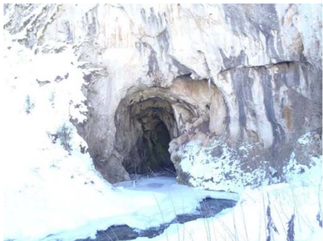
Poniranje Svrliškog Timoka