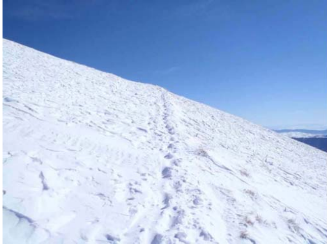
Beo sneg i plavo nebo

Brzo smo napredovali. Nas iz Pobjede bilo je 15, iz Prokuplja 5 planinara i još možda desetak planinara koji su po grupicama peli samostalno. Naša grupa se dosta bila razvukla iz razloga što su neki žurili kondicije radi, dok su drugi uživali, slikali, meditirali u zavetrinama i upijali poglede na okolne planine koji su ovoga dana stvarno bili fenomenalni. To je bio jedan od onih poklonjenih dana koji planina podari upornim planinarima. Zbog takvih dana vredi odlaziti u planinu. Ja sam na vrhu bila u 12 i 45. Mnogi su bili većstigli. Skupili smo se, slikali se, pojeli po nešto, napravili kratku pauzu i krenuli natrag.