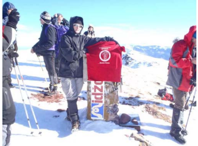
Vrbica na 2.168 mnv

Tih 8 kilometara od vrha, do doma na Babinom zubu, prešli smo za dva ipo sata. Vetar je mestimično bio baš jak, mada nije bilo hladno. U domu smo napravili pauzu da se cela grupa sakupi, jer bilo je tu nekoliko njih koji su uživali u skijanju i šetnji po okolini. Veče smo opet proveli u Mezdreji, gde su nam domaćini ponudili ukusnu večeru i opet živu muziku za prijatnije druženje.