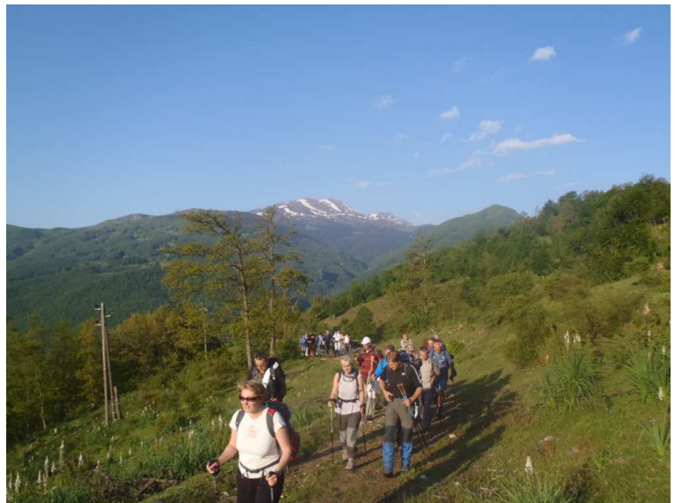
Grupa raspoložena za pešačenje

Стаза почиње из села, са великим успоном, и онда кроз шуму и ливаде излази на велики плато са кога се пружа предиван поглед на цео гребен Кобилице, са једне стране, и друге врхове Шаре, са друге стране. На том платоу је катунско насеље које је живо и у коме је било осим одраслих, чак и неколико детета који су нас радознано гледали. Док нисмо кренули гребеном на завршни успон није ми изгледало дугачко, ...али, ...одужило се. У размаку од сат времена, 9 и 30 и 10 и 30, цела група је изашла на врх.