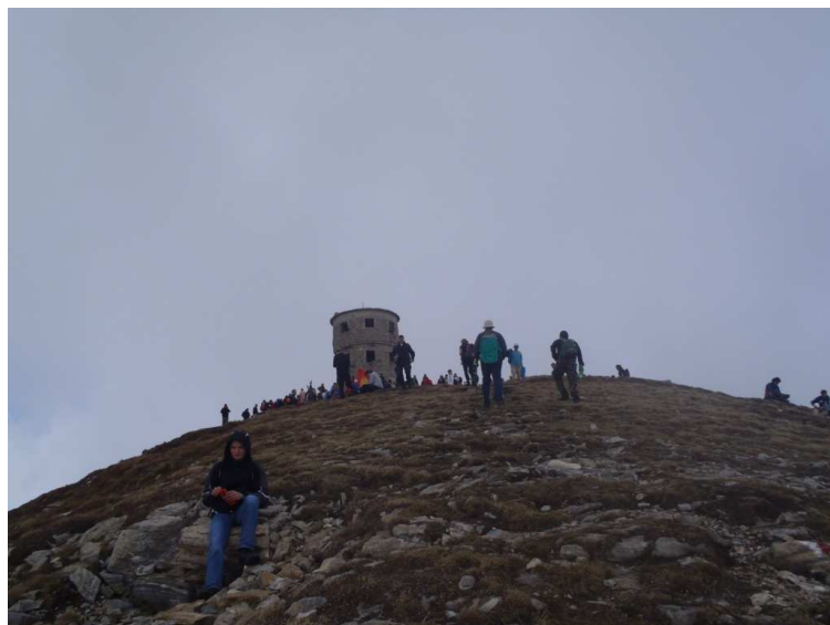
Titov vrv, 2747mnnv