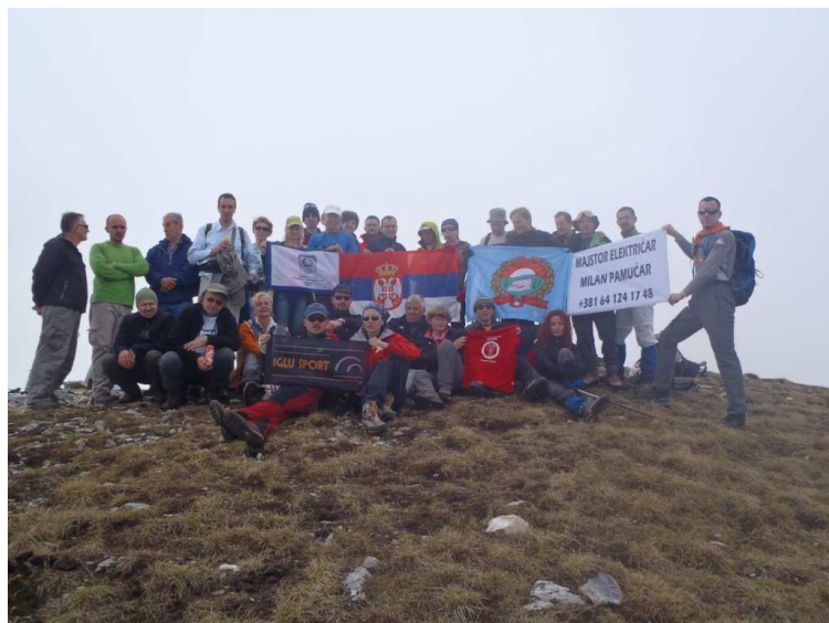
Grupa na vrhu

Нисмо се дуго задржали јер су се у међувремену навлачили облаци и магла, а на самом врху се у даљини чула и нека грмљавина,... па смо после сликања, одмах кренули натраг, ...све време мислећи на временску прогнозу. Захваљујући тим мислима, са гребена смо сишли веома брзо, и пре уласка у шуму, коначно, сели да се одморимо. Нисмо ни приметили да су се облаци повукли, небо се поново отворило, сунце припекло, ... могли смо да уживамо.