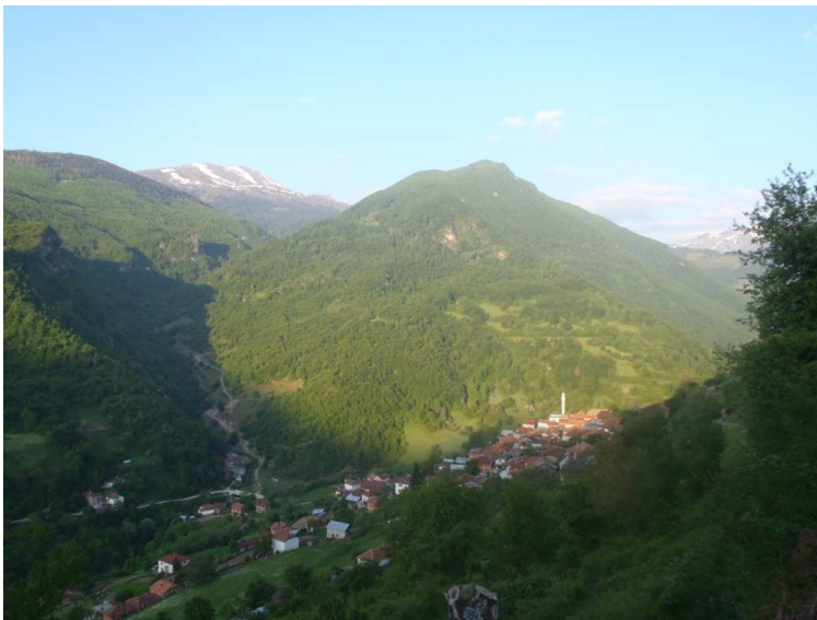
Selo Brodec na oko 1000mнв

Временска прогноза је била изузетно неповољна : већ од 11 сати су најављивали кишу, грмљавину, суснежицу и снег на планинама ...а јутро је било ... само како се пожелети може.