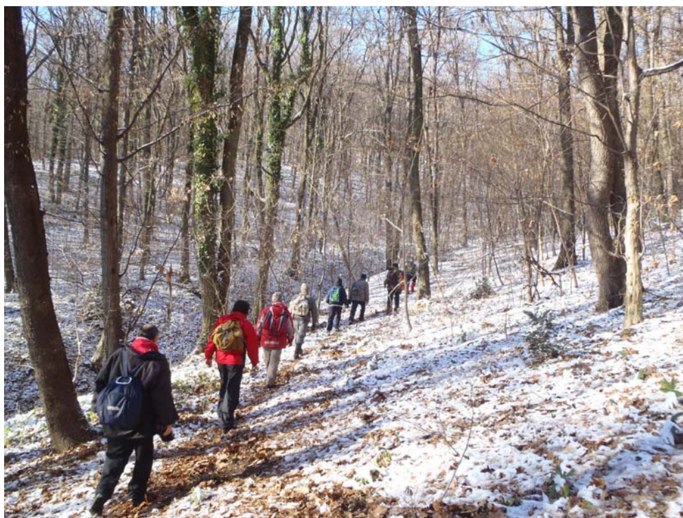
Много је било лепо ићи кроз шуму