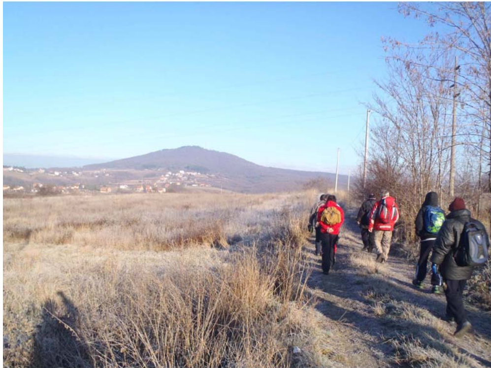
Хладан, али сунча ндан

Кренули смо возом из Велике Плане у 6 и 30. У Рипањ смо стигли у 8 и 15. Све време пута нас је пратила густа магла. У Рипњу је грануло сунце. Попили смо кафу и доручковали у посластичарници и на стазу кренули у 8 и 45. Организаторе нисмо чекали, јер су они много каснили, па смо у договору са њима кренули сами. Од железничке станице крећемо у правцу југоистока, преко ромске махале, па на север до коте 256, а онда се пољским путем спуштамо на изохипсу од 170 м и долазимо до напуштеног рудника живе.