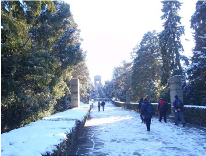
Споменик Незнаком јунаку