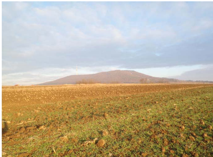
Авала на поподневном сунцу

Шумским путем у правцу севера до планинарског дома Чарапићев Брест. Организатори су свима поделили учесничке књижице, а друштвима захвалнице. Било је 32 друштва и 412 пријављених планинара. Након ручка и одмора, крећемо у 14 и 10 путем 4П5. Долазимо до Пиносаве и раскрснице са котом 266, прелазимо пут 6А7 Рипањ -Београд и у правцу запада се спуштамо, поред школе, и гребена Таборишта до Топчидерске реке, а онда поред пруге долазимо до стајалишта Рипањ Колонија. Ту у 16 сати улазимо у воз који нас враћа у Велику Плану.