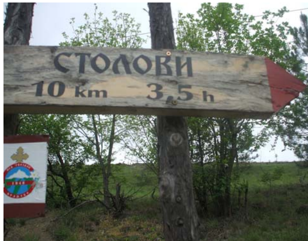
Тамо идемо ...

Пешачење је започето из Каменице. После успона на Орловац, следећи циљ је био сам врх Столова – Усовица - 1375 м.