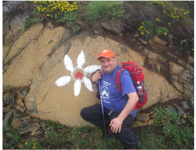
Нарцис на стени