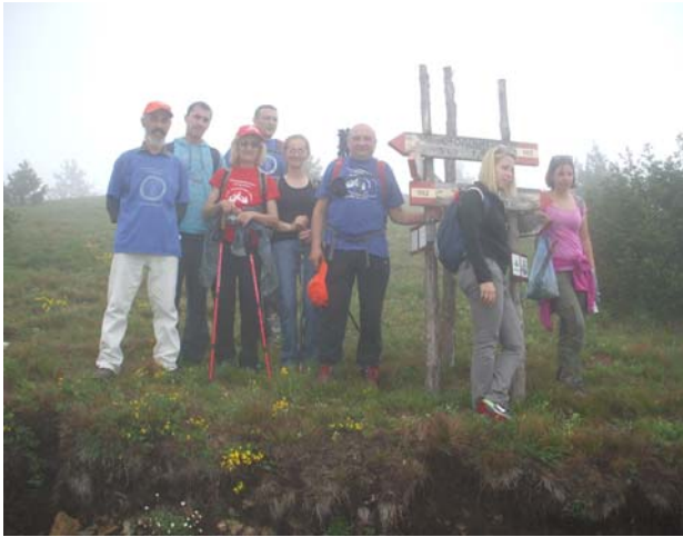
Киша још није почела