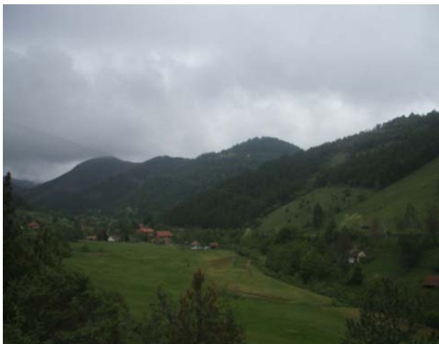
Горе облаци, доле све зелено

Пешачење је започето из Каменице. После успона на Орловац, следећи циљ је био сам врх Столова – Усовица - 1375 м.