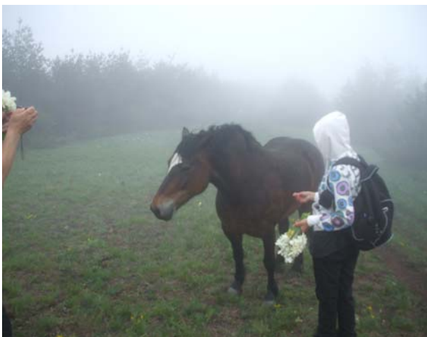
... и познати коњи са Столова