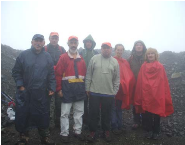
На врху у облацима