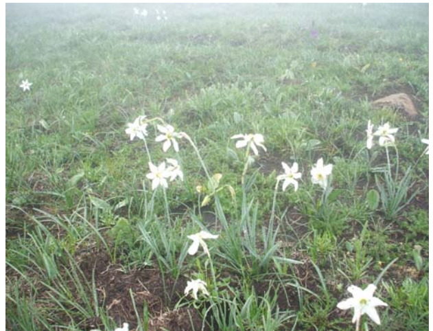
А ту су и нарциси на киши ...