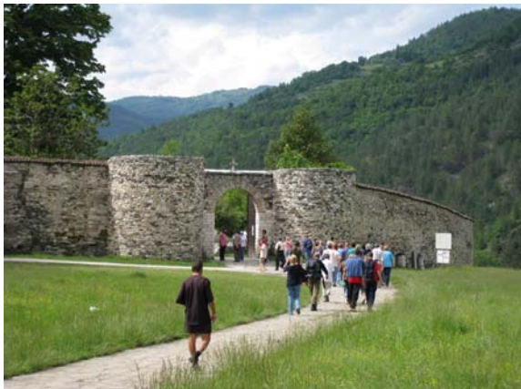
На улазу у комплекс Манастира Студенице

Након тога, планинари су обишли и Манастир Студеницу, а на крају похода организовано је краће "дружење" са прасетом и јагњетом.