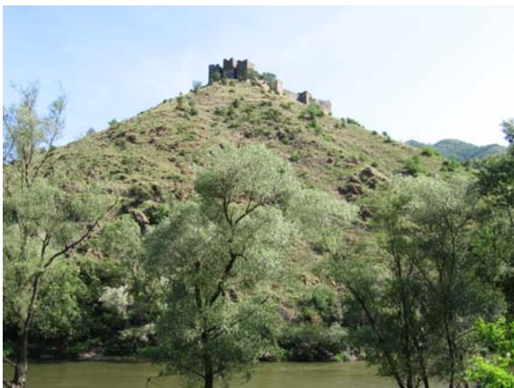
Средњевековни град Маглич

Планинари су најпре обишли средњевековни град Маглич - изузетан објекат са којег се пружа поглед на долину Ибра и путеве који се њом пружају.