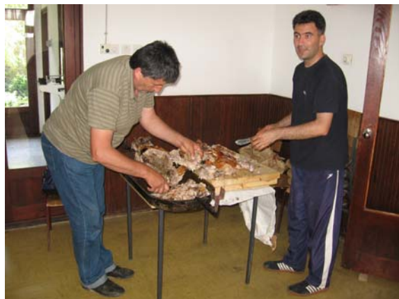
... И убрзо нестало.