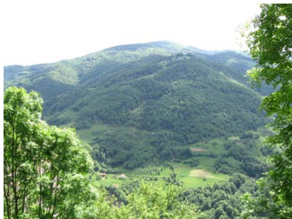
Поглед са испоснице на падине Радочела