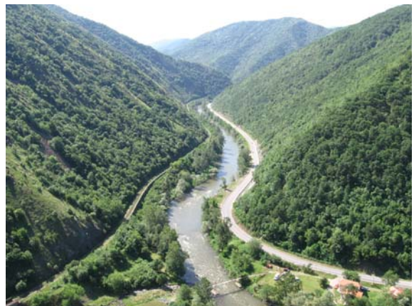
Поглед са Маглича на долину Ибра