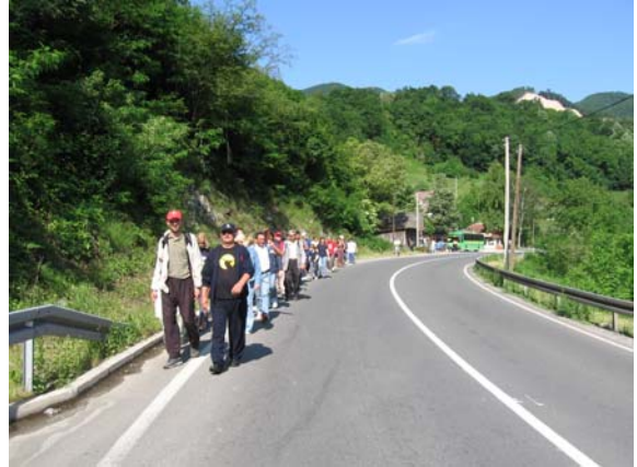
Организована колона планинара на Ибарској магистрали

Планинари су најпре обишли средњевековни град Маглич - изузетан објекат са којег се пружа поглед на долину Ибра и путеве који се њом пружају.