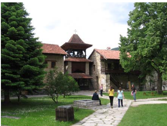
У порти Манастира Студенице