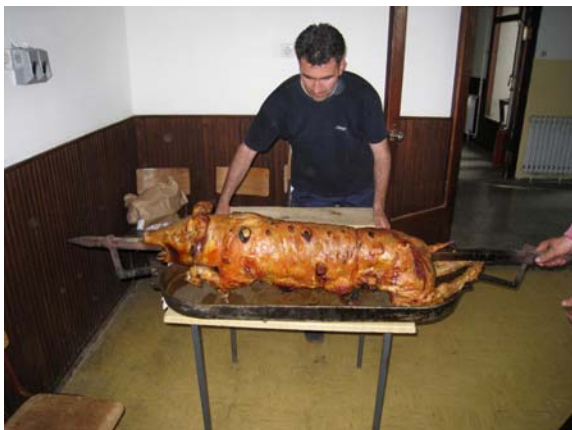
Стигло је прасе на ражњу ...

Овом акцијом, ПД Врбица обележило је први масовни поход који је самостално организовало маја 2006. године на планину Чемерно.