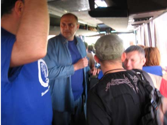
Интересовање за излет је било толико да је у аутобусу било и стајања

У недељу 25.05.2008. године, Планинарско друштво "Врбица" је организовало излет са успоном на Маглич у долини Ибра и Савину испосницу - 848 м на Чемерном. Учешће је узело 63 планинара, од тог броја 13 чланова ПК Јасеница из Смед. Паланке.