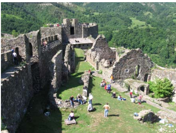
На зидинама Маглича