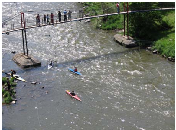
Кајакаши на Ибру испод Маглича