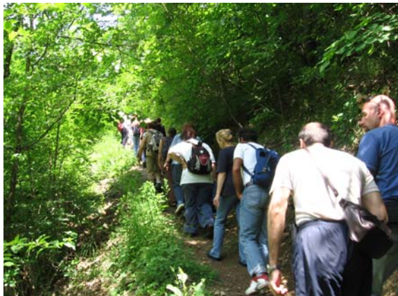
На стази ка Савиној испосници

Сама Савина испосница, која је настала почетком 13. века, пружа посебан естетски и духовни доживљај и код посетилаца изазива велико задовољство.