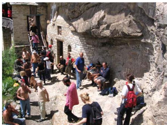
Одмор после успешног успона

Са испоснице се пружа леп поглед на долину Студенице и падине Чемерног и Радочела.