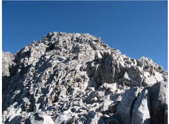
Пред Јужним Кучким Комом

По најбољем могућем времену за успон, излазим на Јужни Ком (2487 м) у 12:40. Десетак метара од врха седело је 5-6 планинара; када са излазио на врх само је један погледао у мом правцу, поздравио сам га, а он ми је одмахнуо. Остали, за десетак минута колико сам био на врху, ни једног тренутка нису погледали у мом правцу ?!