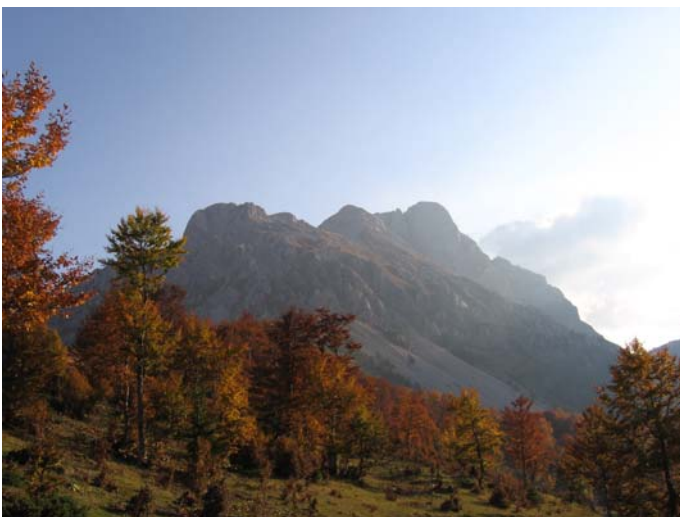
Јесење боје 2