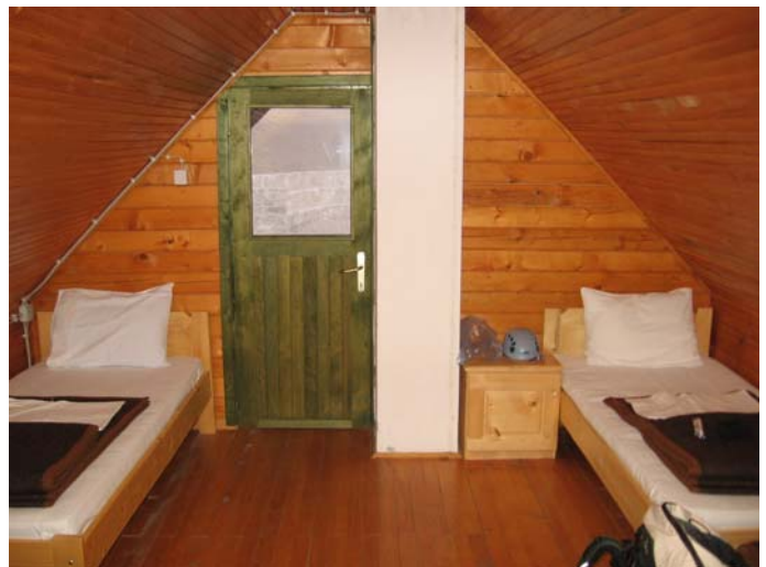
... и удобни кревети.