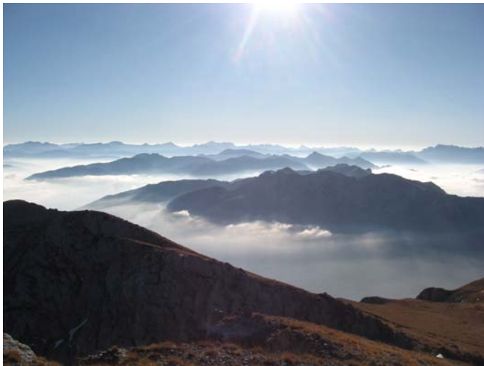
Поглед са Васојевићког Кома на исток

Када смо изашли са Штавне и започели успон ка врху Васојевића, а самим тим се његовом западном страном заклонили од ветра, угледали смо приказ који нас је пратио све до врха: на истоку, доккле поглед досеже, све је било прекривено густим облацима - једино су препознатљиви високи планински врхови били обасјани јутарњим сунцем; преко Штавне лете облаци али никако да досегну до Љубана – на западу нема ни облачка, све је кристално јасно – препознајемо Морачке планине, Сињајевину, Дурмитор, па чак на хоризонту и карактеристична пераја Витлова на Биочу.