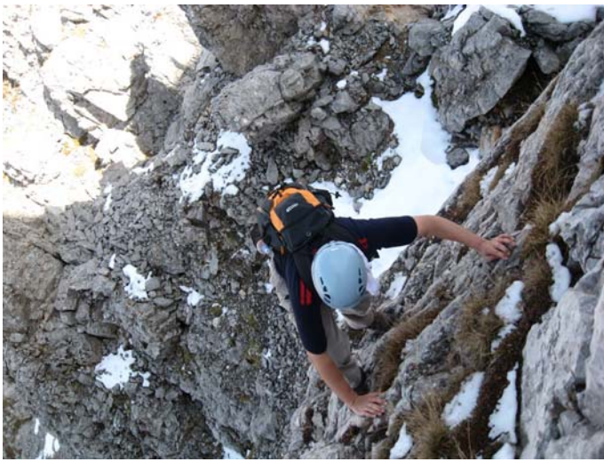
Завршни део успона