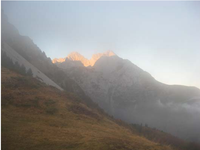
Ми у магли, на врховима сунце

Према Васојевићком Кому, из Еко катуна, кренули смо у 6:45. Као и претходног јутра, густа магла је обавијала Штавну. Но, чим смо изашли на превој изнад катуна и осетили источни ветар који је великом брзином носио облаке ка Љубану – знали смо да ће то бити предиван дан.