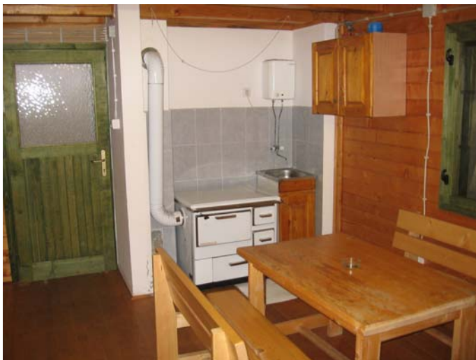
А унутар објекта "Смедеревац" ...