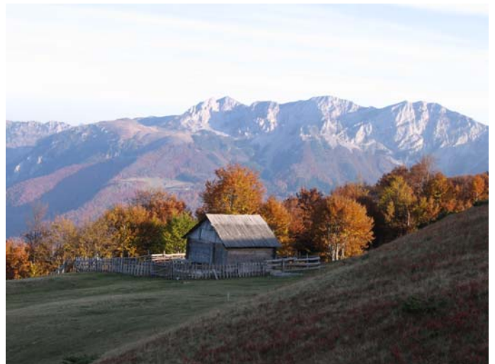
Катун на Штавни

Пакујемо се, опраштамо се са љубазним домаћином Еко катунца и одлазимо ка Трешњевику. Морамо кући – ујутру радимо!