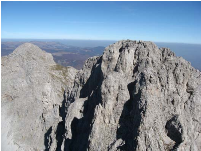
Северни и Средњи Кучки Ком (поглед са Јужног)

Не знам одакле су ти планинари; једино што сам успео да видим је да су неки носили мајце са ознакама неког планинарског друштва из Колашина.