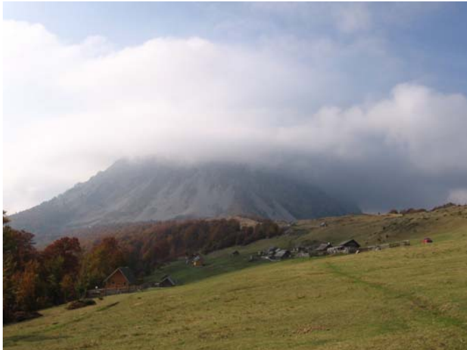
Врхови у облацима