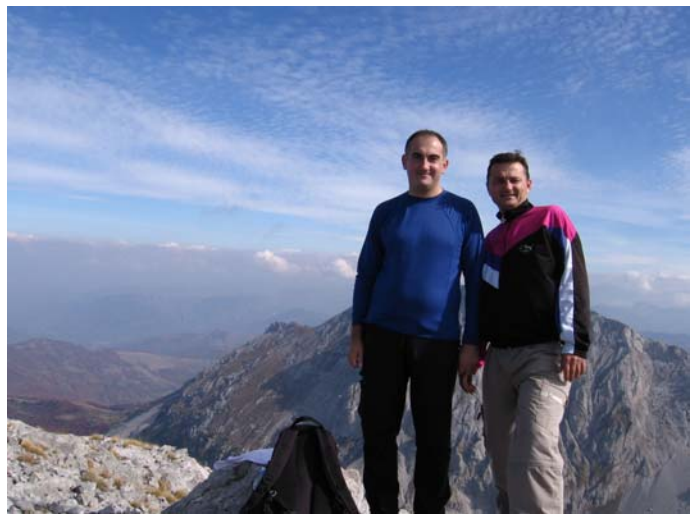
На Љеворечком Кому