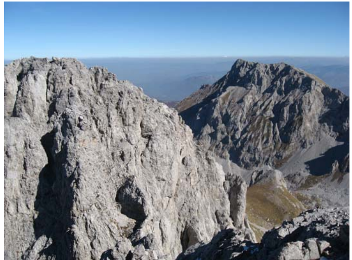
Средњи Кучки и Васојевићи Ком (поглед са Јужног)

Са врха меркам Средњи ком, који је, барем ваздушном линијом, јако близу. Но, треба се спустити нешто више од 200 м како би се започео успон на овај, ни мало гостољубиви врх. Главни проблем успона на овај врх је велика крушљивост: камење стало пада и не постоји скоро ни један сигуран ослонац. Успон почиње кроз кулоар у облику левка са висине од око 2300 м. Прошле године када сам пео овај врх није био обележен и пењали смо га више по осећају, тражећи најбољи пут и, осим опасности од рушења камења, нисмо имали већих проблема. У међувремену, неко је обележио стазу до врха. Већ на самом почетку било је уочљиво да су неке марке биле постаљене на проблематичним местима, иако је било алтернативних праваца који су били логичнији и мање опасни. Но, до 2400 м то обележавање и има неког смисла, али од те тачке, која је заправо разделник између десног подврха и левог главног врха и препознаје се по стени која је заглављена између њих – правац који је обележен је скроз погрешан. Наиме, ту марка показује да треба ући благо лево у прилично стрму стеноу. Хватови су добри, али је превише стрмо за једну планинарску стазу без коришћења обезбеђења и тако у наредних 50-60 м. Није проблем то попети, али одпењавати такву деоницу без осигурања је прилично опасно и глупо.