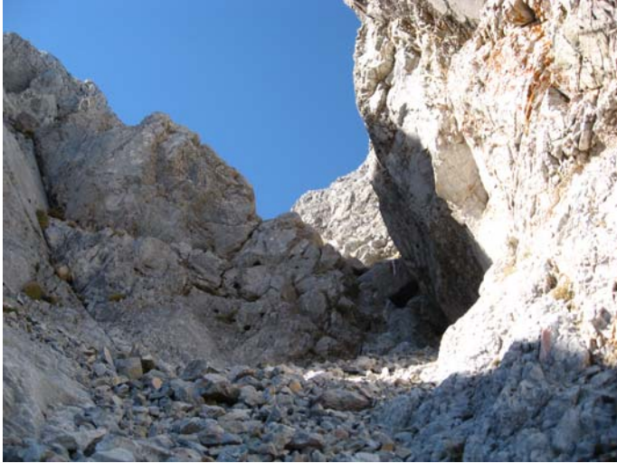
Пред Средњим Кучким Комом

На врху сам био у 14:00. ГПС показује висину од 2488 м. Не задржавам се превише, с обзиром да на овом врху имам осећај као да се налазим на врху неке гомиле шљунка; осећај као да ће се сваког тренутка све урушити !? При силаску не користим маркирану стазу, већ са врха продужавам неколико десетина метара преко - истина - веома стрмог и крушљивог гребена и у наредних 100 м силазим стазом која иде са десне стране маркиране стазе. Колико је ова деоница лакша од маркиране, потврђује и то што ни једног тренутка није било потребно одпењавати стену. Остатак спуштања, уз повећан опрез, прошао сам без проблема.