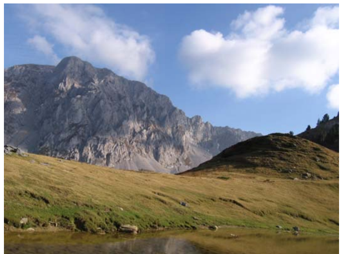
Језеро, ливада, планина, ...

До Еко катуне стижемо нешто пре 17:00. Користимо све благодети овог места – тура пива у ресторану, туширање, вечера у угрејаном дневном боравку, и пошто смо претходне ноћи врло мало спавали смештамо се у удобне кревете нешто пре 20:00, са договореним буђењем у 5:30.