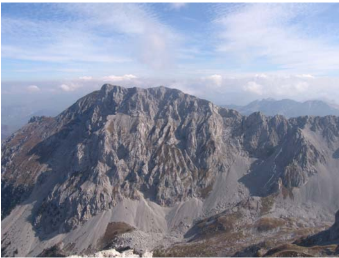
Васојевићи Ком са својим познатим сипарима