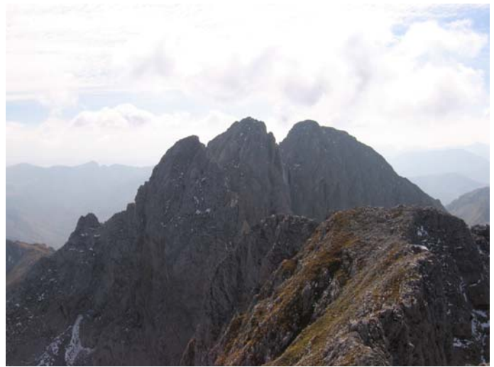
Средњи и Јужни Кучки Ком