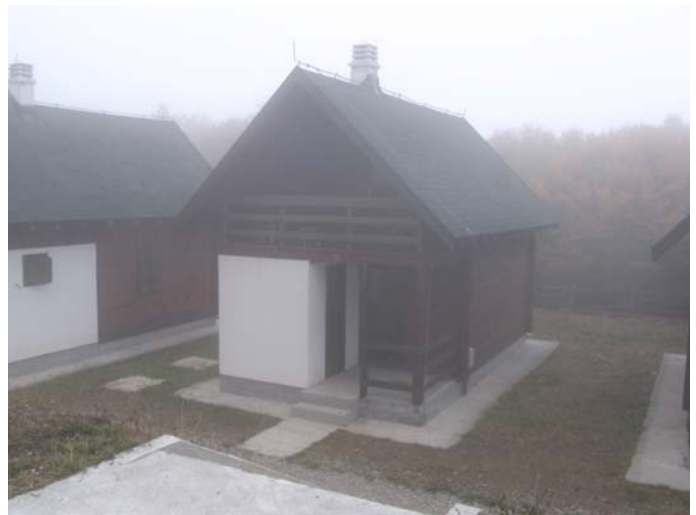
Наш објекат у Еко катуну