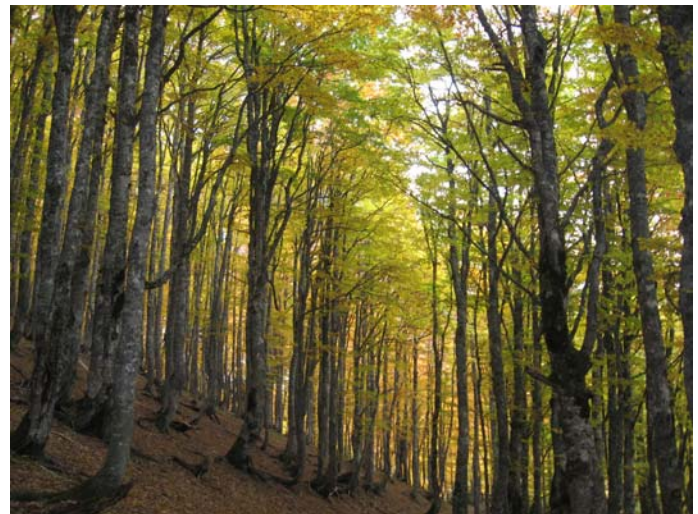
Букова шума у јесен