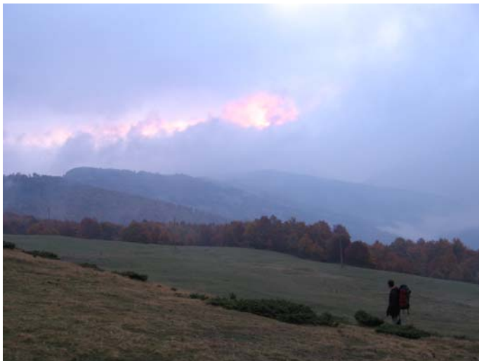
Јутро на Штавни

Већ поменути таксијем на Трешњевик стижемо око 6:00. Још увек је мрак, а магла и облаци око нас још више утичу на смањење видљивости. Уз помоћ чеоних лампи настављамо ка Штавни и уз прве зраке сунца који се једва пробијају кроз облаке стижемо до Еко катуну за непун сат. Ту нас дочекује љубазни домаћин и чашћава нас кафом и чајем. Смештамо се у једном од објеката који пружају све савремене услове за смештај до 5 особа - луксуз на који планинари баш и нису навикли.