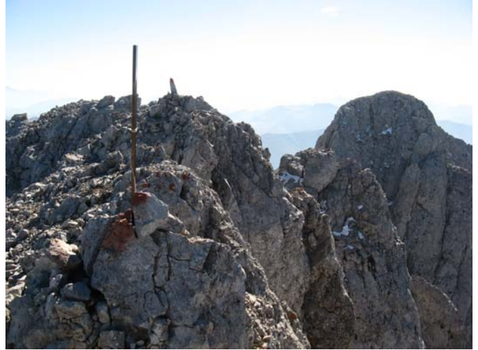
Средњи Кучки Ком (као да ће сваког тренутка да се сруши)

На Штавну стижем нешто пре 17 часова, не превише уморан. Очекивао сам да ћу се више уморити с обзиром на тежину коју сам морао носити на све ове врхове од (0,104 тоне).