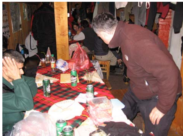
Дружење у "Евересту"

Како ко стиже у дом, по правилу наручује чај, чорбу а неки и пиво. Пријатно смо изненађени да у дому на 2700 м (до кога не постоји колски пут) све ово добијамо по врло повољним ценама (чорба је 2 лева или око 80 динара а пиво од ½ литра 2,5 лева или нешто мало више од 100 динара). Убрзо почињемо и са обилном вечером а све у циљу да што више смањимо велике количине намирница које смо понели са собом.