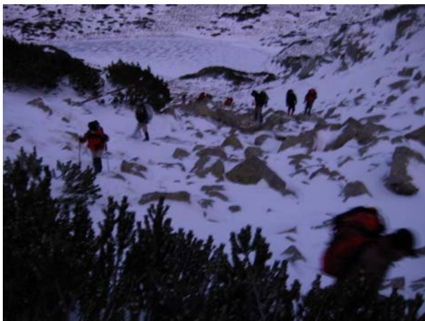
У сумрак, с камена на камен