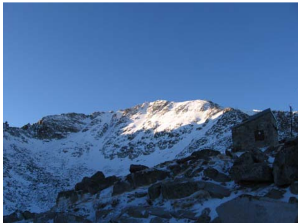
Јутарње сунце обасјало Мусалу

Недељно јутро је свануло потпуно ведро, без ветра и са температуром која је тек неколико степени испод нуле - савршено за успон. Мусала је ту одмах изнад нас окупана јутарњим сунцем. Све је указивало да нас чека леп и успешан дан, што се на карју показало као тачно.