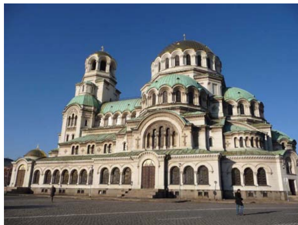
Храм Александра Невског

За Београд крећемо у 15,30 и после удобне вожње са две паузе и са пријатним искуством на нашој граници где нам је у аутобусу пасоше оверила врло љубазна припадница МУП-а са одличним познавањем енглеског језика (комуницирала са нашим сапутником из Чилеа), стижемо у Велику Плану око 21,30.