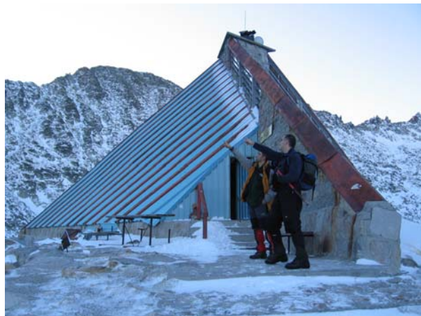
Аца и Добрица разматрају куда ће после Мусале

Крећемо на успон у 8,15 и гробеном уз малу помоћ сајле која је потребнија када су временски услови лошији, стижемо на највиши врх Балканског полуострва за непуних 45 минута. Поглед је фантастичан, задовољство још веће. Некима је ово само још један од многобројних успона преко 2500 м, али је зато некима највиши врх на који су до сада изашли. На врх је изашло укупно 25 планинара, од тога два члана ПД Врбица. Иначе на Мусали (2925 м) постоји метеоролошка станица (где је могуће печатирати планинарску књижицу и у којој су нам врло љубазно понудили чај) и истраживачка станица Бугарске академије наука.