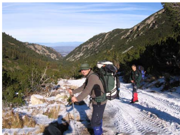
На стази ка Боровецу