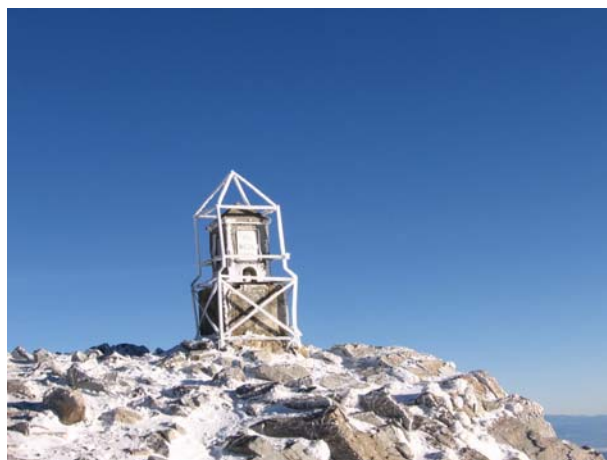
Највиши врх Риле и Балканског полуострва