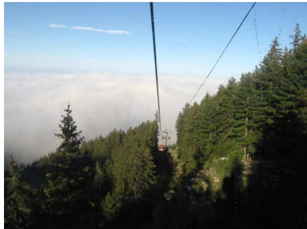
Поглед из гондоле