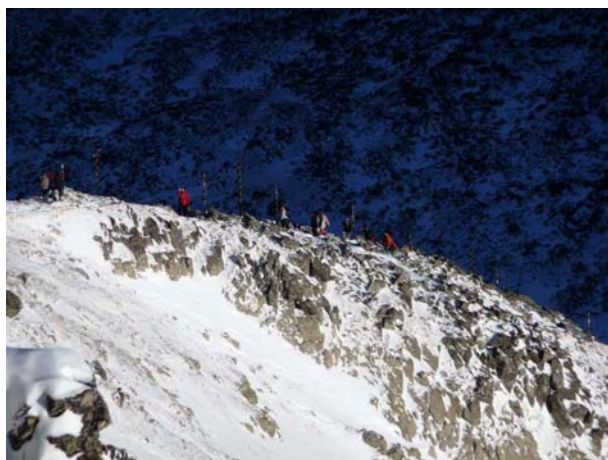
На гробену ка Мусали

Крећемо на успон у 8,15 и гробеном уз малу помоћ сајле која је потребнија када су временски услови лошији, стижемо на највиши врх Балканског полуострва за непуних 45 минута. Поглед је фантастичан, задовољство још веће. Некима је ово само још један од многобројних успона преко 2500 м, али је зато некима највиши врх на који су до сада изашли. На врх је изашло укупно 25 планинара, од тога два члана ПД Врбица. Иначе на Мусали (2925 м) постоји метеоролошка станица (где је могуће печатирати планинарску књижицу и у којој су нам врло љубазно понудили чај) и истраживачка станица Бугарске академије наука.