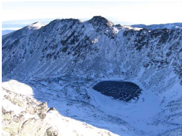
Планинарски дом поред залеђеног језера