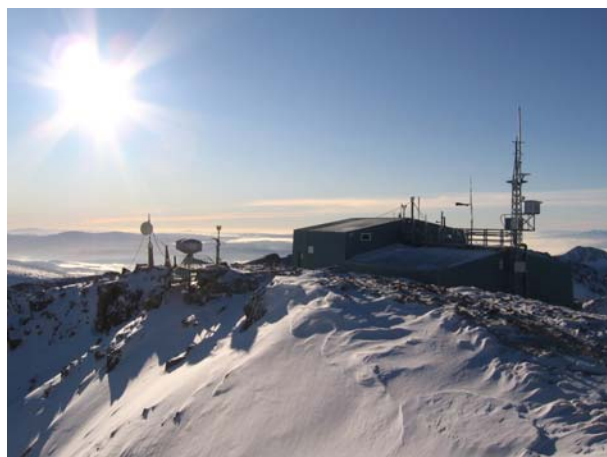
Истраживачка станица Бугарске академије наука