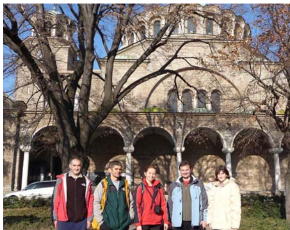
У шетњи Софијом

У понедељак у 8,30 крећемо из Боровеца за Софију. Време је и даље сунчано и пријатно, а нас очекује шетња по Софији уз обавезну посету продавницама у којима се продаје планинарска опрема (Стената, Макалу Спорт и др., где су неки од нас оставили солидну количину лева). Следи обилазак културно-историских споменика и боравак у неком од ресторана – да се мало окрепимо пред пут за Београд.