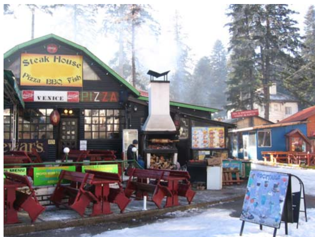
Прасе је на ражњу, али смо се ми одлучили за друге специјалитете

Следило је поподневно и вечерње дружење у пријатним угоститељским објектима Боровеца где, као и у другим местима у Бугарској, врло често пуштају "нашу" музику, што смо ми покушали да избегнемо. Успевали смо у томе доста дуго, али су нас на крају ипак стигли са Недом Украден, Мишом Ковачом и сл. али срећом без Цеце. Ноћили смо у поменутом хотелу "Ела" (са ***) који је сасвим добар и који би задовољио и знатно пробирљивије госте од нас.