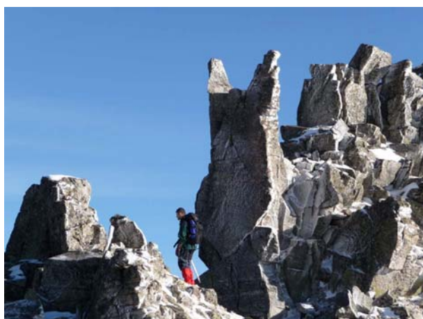
Аца разматра куда даље