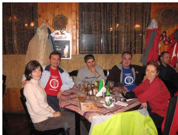
Дружење уз освежење (на црвеној и плавој мајици пише: "Планинарско друштво Врбица")

У понедељак у 8,30 крећемо из Боровеца за Софију. Време је и даље сунчано и пријатно, а нас очекује шетња по Софији уз обавезну посету продавницама у којима се продаје планинарска опрема (Стената, Макалу Спорт и др., где су неки од нас оставили солидну количину лева). Следи обилазак културно-историских споменика и боравак у неком од ресторана – да се мало окрепимо пред пут за Београд.