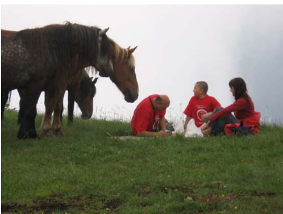
... па су мало и претерали ...

Видици су се делимично "отворили" у повратку када се магла повремено подизала, али тада нас је на моменте пратила слаба киша. Све то је условило да планинари који нису имали одговарајућу обућу на циљ стигну са мокрим ногама.