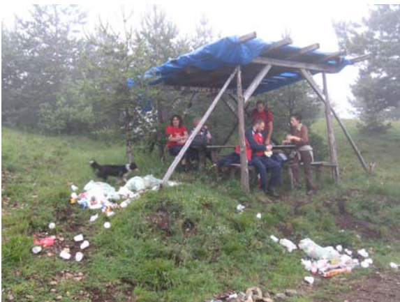
Остаци акције "Нарцису у походе"