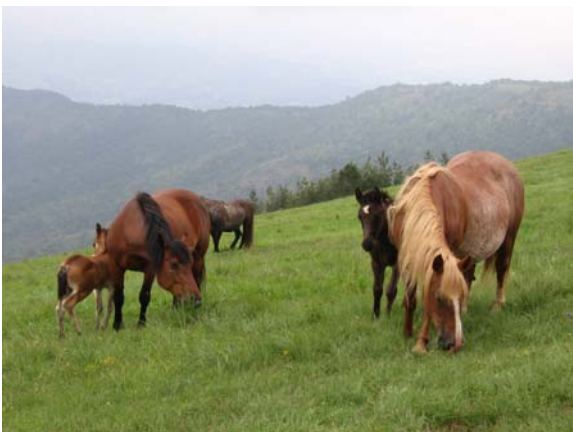
На врху су нас дочекали коњи ...