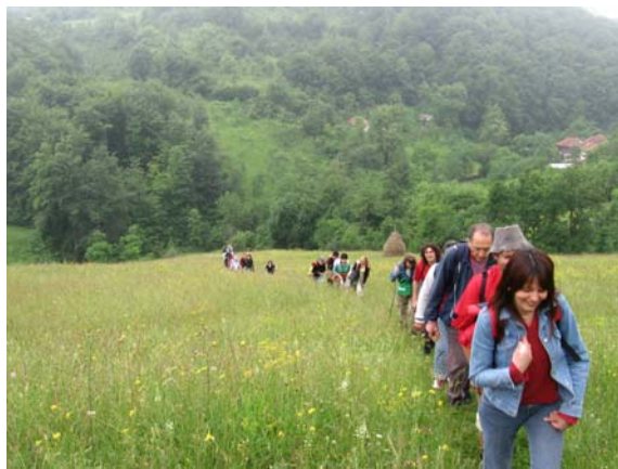
Кроз ливаде и пашњаке

Успон до Усовице изведен је од планинарског дома у Брезни (680 м) и, по магловитом и на моменте кишовитом времену, трајао је нешто више од три сата. Стаза је разнолика и врло интересантна, са већим и мањим успонима, равним деловима, низбрдицама... Стаза делимично иде колским путевима, делимично кроз ливаде и пашњаке и такорећи целом дужином није заклоњена од сунца, тако да се не препоручује успон када је велика врућина. У том смислу и нисмо превише жалили што је било облачно време, али је проблем стварала густа магла која није дозвољавала уживање у прелепим пејзажима Столова и околних планина.