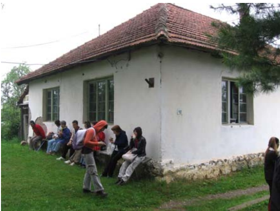
Пред полазак испред планинарског дома у Брезни

У недељу 15.06.2008. године, Планинарско друштво "Врбица" је организовало излет са успоном на Столове код Краљева – врх Усовица 1375 м. Учешће је узео 41 планинар, од тог броја 25 чланова ПД "Врбица" и 13 чланова ПК Јасеница из Смед. Паланке. Три планинара из Краљева су били домаћини и водичи.