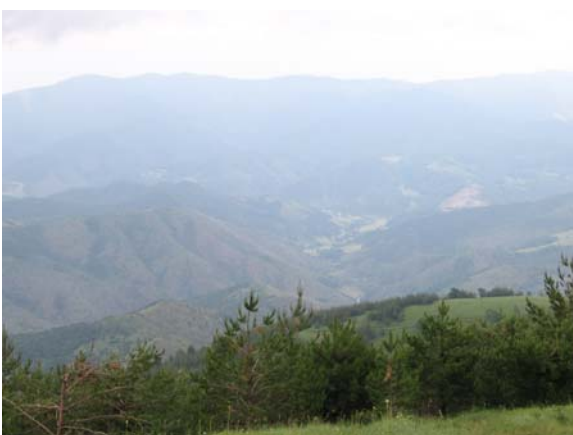
Отворени видици у повратку 1