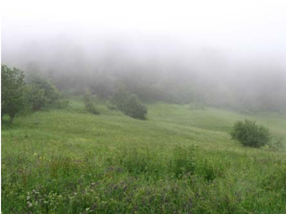
Магла, магла свуда око нас 1

Успон до Усовице изведен је од планинарског дома у Брезни (680 м) и, по магловитом и на моменте кишовитом времену, трајао је нешто више од три сата. Стаза је разнолика и врло интересантна, са већим и мањим успонима, равним деловима, низбрдицама... Стаза делимично иде колским путевима, делимично кроз ливаде и пашњаке и такорећи целом дужином није заклоњена од сунца, тако да се не препоручује успон када је велика врућина. У том смислу и нисмо превише жалили што је било облачно време, али је проблем стварала густа магла која није дозвољавала уживање у прелепим пејзажима Столова и околних планина.