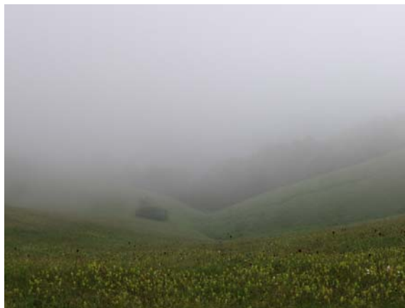
Магла, магла свуда око нас 2