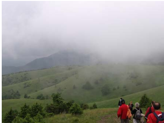
Врхови у облацима