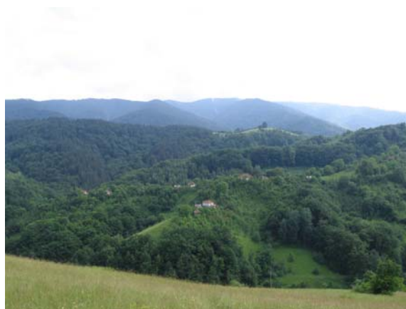
Отворени видици у повратку 2

Повратак је трајао нешто мање од три сата, с тим што је одлучено да се група врати другим путем – до Каменице (350 м) где је чекао аутобус. Укупно у оба смера је пређено више од 20 км са око 750 м успона и више од 1000 м у силаску, што значи да је ово једна од јачих масовних планинарских тура које је организовало ПД "Врбица". Нарочито радује податак да је више од 90% учесника акције прешло комплетну стазу.