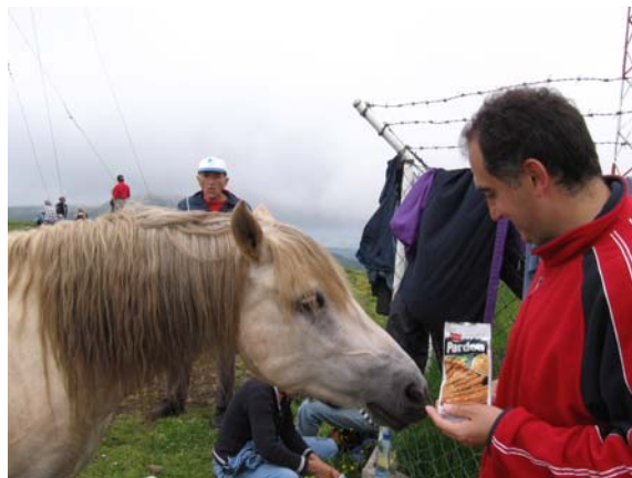
... и врло радо поделили храну са нама ...

Видици су се делимично "отворили" у повратку када се магла повремено подизала, али тада нас је на моменте пратила слаба киша. Све то је условило да планинари који нису имали одговарајућу обућу на циљ стигну са мокрим ногама.