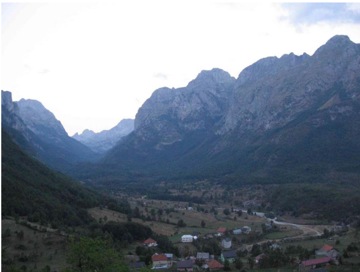
Зора у Вусању и долини "Ропојана" (5:45, 18.08.2007.)

Задовољни што смо нешто пре планираног времена завршили процедуру у пограничној полицији и на сигурном оставили вишак опреме, у 5.30 у суботу 18. августа, крећемо на успон из Вусања (950 мнв) са циљем да попнемо Добру Колату (2528 мнв), Злу Колату (2534 мнв – највиши врх Црне Горе) и Колату (2556 мнв) која се налази на територији Албаније.