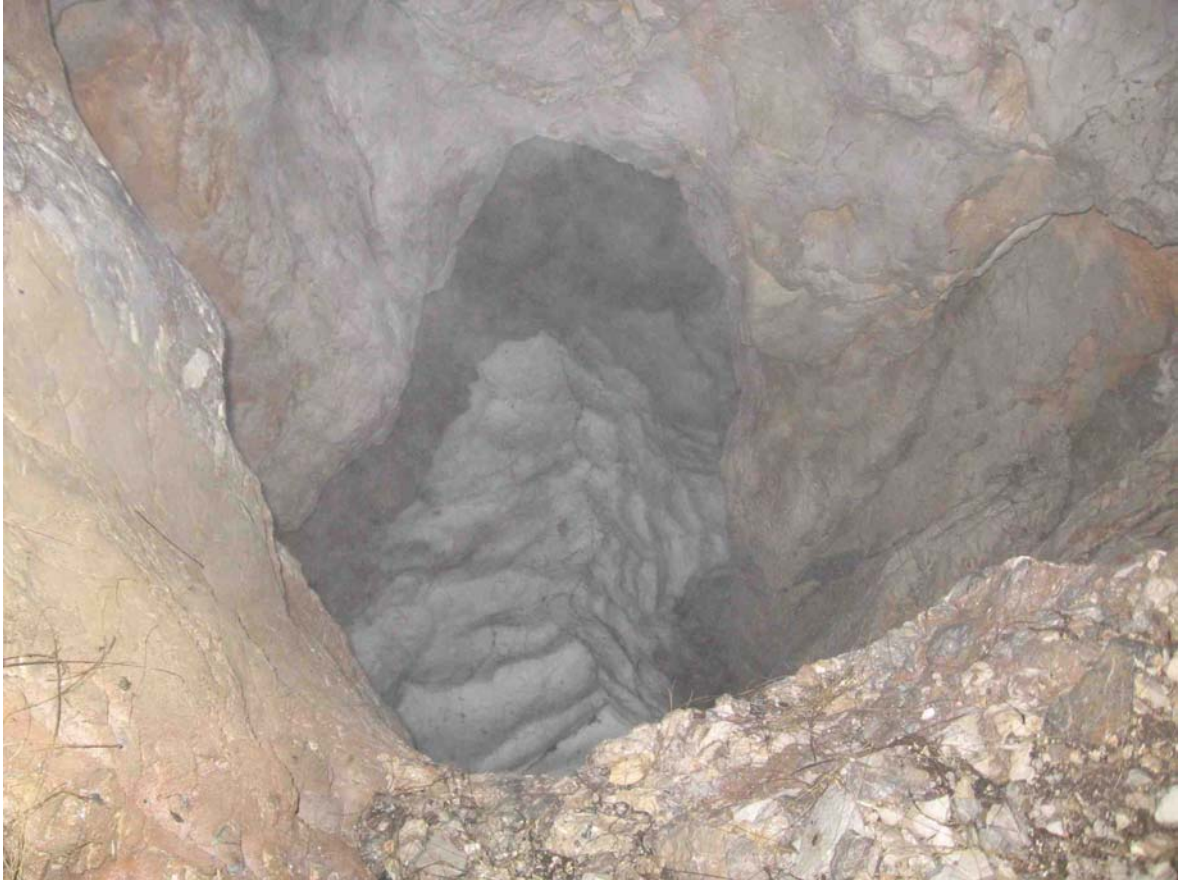
"Ледена" пећина (9:10, 18.08.2007.)

Уз пут правимо паузу за окрепљење поред потока, а убрзо после тога пролазимо поред катуна и бележећи ГПС-ом све успутне изворе воде и друге битне реперне тачке на стази, око два сата од поласка стижемо до последњег извора на путу за Колате. Овај извор ће нам бити од великог значаја у повратку јер су нам резерве воде пресахле пре него што смо очекивали, тако да предлажемо свима који имају намеру да пењу Колате да на овом извору напуне све посуде које су понели јер у наредних 7-8 сати неће имати могућност да се снабдевају водом. У наставку пута повремено конзумирамо врло укусне дивље малине које ће нам много више значити у повратку када будемо остали без воде и око три и по сата од поласка стижемо до ледене пећине из које нас "удара" хладан ваздух који делује врло освежавајуће.