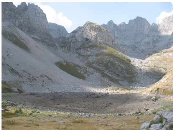
Овде је било језеро

Ускоро стижемо до превоја на 2250 (мнв) одакле се креће у завршни успон на врх. Правимо паузу за окрепљење и ту остављамо цепин односно штапове јер нас очекује пролаз кроз стену, сипар и крушљиви кулоар који су технички захтевнији него дотадашња стаза.