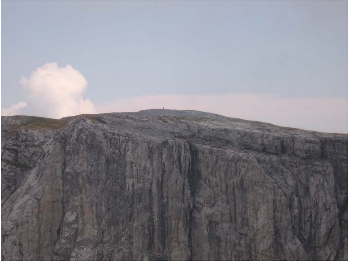
На врху Колата (2556 мнв) у Албанији (13:40, 18.08.2007.)

Повратак је прошао без већих проблема – као што је већ напоменуто мало смо кубурили са недостатком воде (то су колико толико надокнадиле дивље малине) тако да смо једва чекали да стигнемо до првог извора.