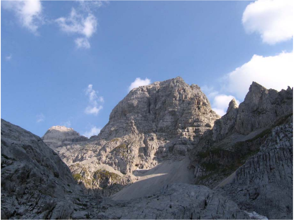
Поглед на Маја Језерце (16:40, 19.08.2007.)

После нешто мало мање од једанаест сати од поласка, пређених 20 км и око 1800 м успона и исто толико ниспона стижемо до Застана. Ту нас не очекује заслужени одмор јер смо одлучили да спакујемо ранчеве и одмах кренемо ка Вусању - још 7 км хода са целокупном опремом на леђима и око 350 м висинске разлике, овога пута у силаску. Поздрављамо се са "домаћинима" и настављамо пут. Већ је увелико пао мрак када смо стигли до Вусања где нас је чекао такси, којим одлазимо у Беране, одатле ноћним аутобусом до Младеновца и првим јутарњим возом од Младеновца до Паланке, где стижемо у понедељак 20. августа 2007. око 6:30.