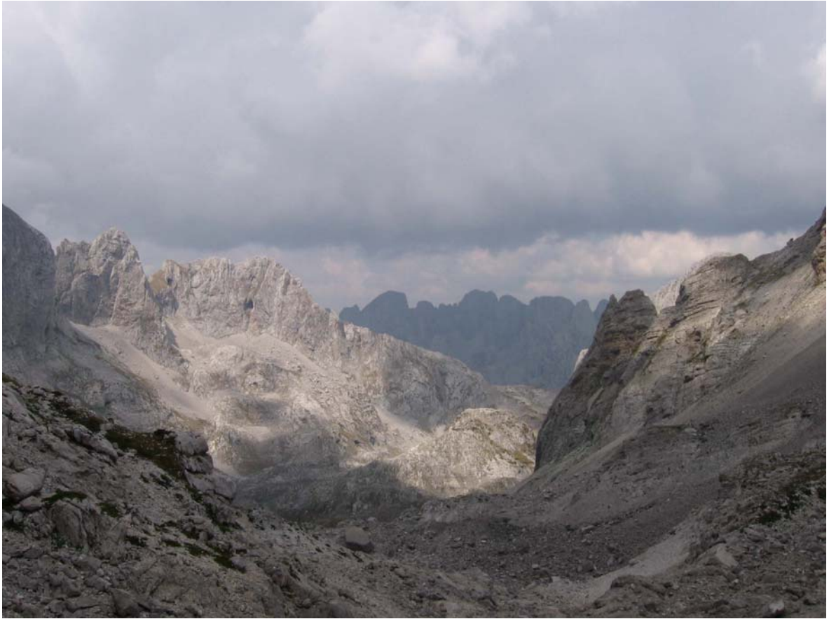
Карактеристичан призор са Проклетија (12:30, 19.08.2007.)

И коначно после шест сати од поласка стижемо на циљ: Маја Језерце највиши врх Албаније и Проклетија (2694 мнв) делује импресивно. Свуда околу колико се поглед пружа изузетни призори које је тешко описати – једноставно то треба доживети. Уживамо у погледима на врхове Проклетија, на долину Валбоне... Иако видљивост није сјајна јер се облачност повећала то не умањује осећај среће и задовољства јер када човек дође на овакво место не може бити ни љут, ни мрзовољан, ни незадовољан – једноставно ту не постоји никаква врста негативне енергије.