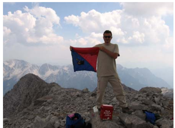
Маја Језерце(2694 мнв) (14:30, 19.08.2007.)