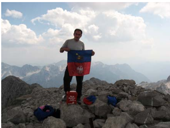
Маја Језерце(2694 мнв) (14:30, 19.08.2007.)

И коначно после шест сати од поласка стижемо на циљ: Маја Језерце највиши врх Албаније и Проклетија (2694 мнв) делује импресивно. Свуда околу колико се поглед пружа изузетни призори које је тешко описати – једноставно то треба доживети. Уживамо у погледима на врхове Проклетија, на долину Валбоне... Иако видљивост није сјајна јер се облачност повећала то не умањује осећај среће и задовољства јер када човек дође на овакво место не може бити ни љут, ни мрзовољан, ни незадовољан – једноставно ту не постоји никаква врста негативне енергије.