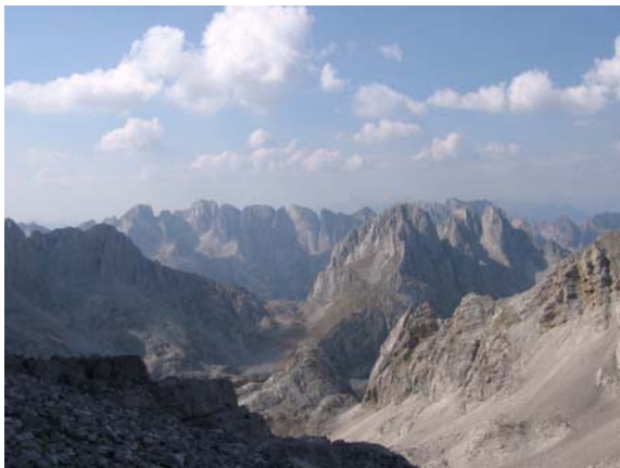
Призор са Проклетија (15:20, 19.08.2007.)

Повратак пролази без икаквих проблема. За разлику од претходног дана залихе воде су потрајале до долине шест језера. Управо ту, код последњег језера сусрећемо групу планинара из Словачке. У овим крајевима су већ неколико дана, а долазе из долине Валбоне и планирају да сутра пењу Маја Језерце. У кратком разговору (лакше се споразумевамо на српском и словачком него на енглеском) размењујемо искуства, а затим настављамо даље ка Застану. И већ после неколико стотина метара, у близини границе између Црне Горе и Албаније сусрећемо групу планинара из Мађарске. И они ће преноћити у долини поред језера и планирају да сутрадан пењу Маја Језерце.