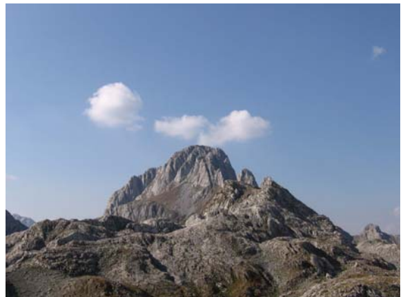
Призор са Проклетија (16:30, 19.08.2007.)