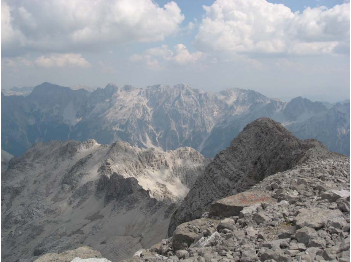
Поглед са врха (2694 мнв) (14:40, 19.08.2007.)

Повратак пролази без икаквих проблема. За разлику од претходног дана залихе воде су потрајале до долине шест језера. Управо ту, код последњег језера сусрећемо групу планинара из Словачке. У овим крајевима су већ неколико дана, а долазе из долине Валбоне и планирају да сутра пењу Маја Језерце. У кратком разговору (лакше се споразумевамо на српском и словачком него на енглеском) размењујемо искуства, а затим настављамо даље ка Застану. И већ после неколико стотина метара, у близини границе између Црне Горе и Албаније сусрећемо групу планинара из Мађарске. И они ће преноћити у долини поред језера и планирају да сутрадан пењу Маја Језерце.